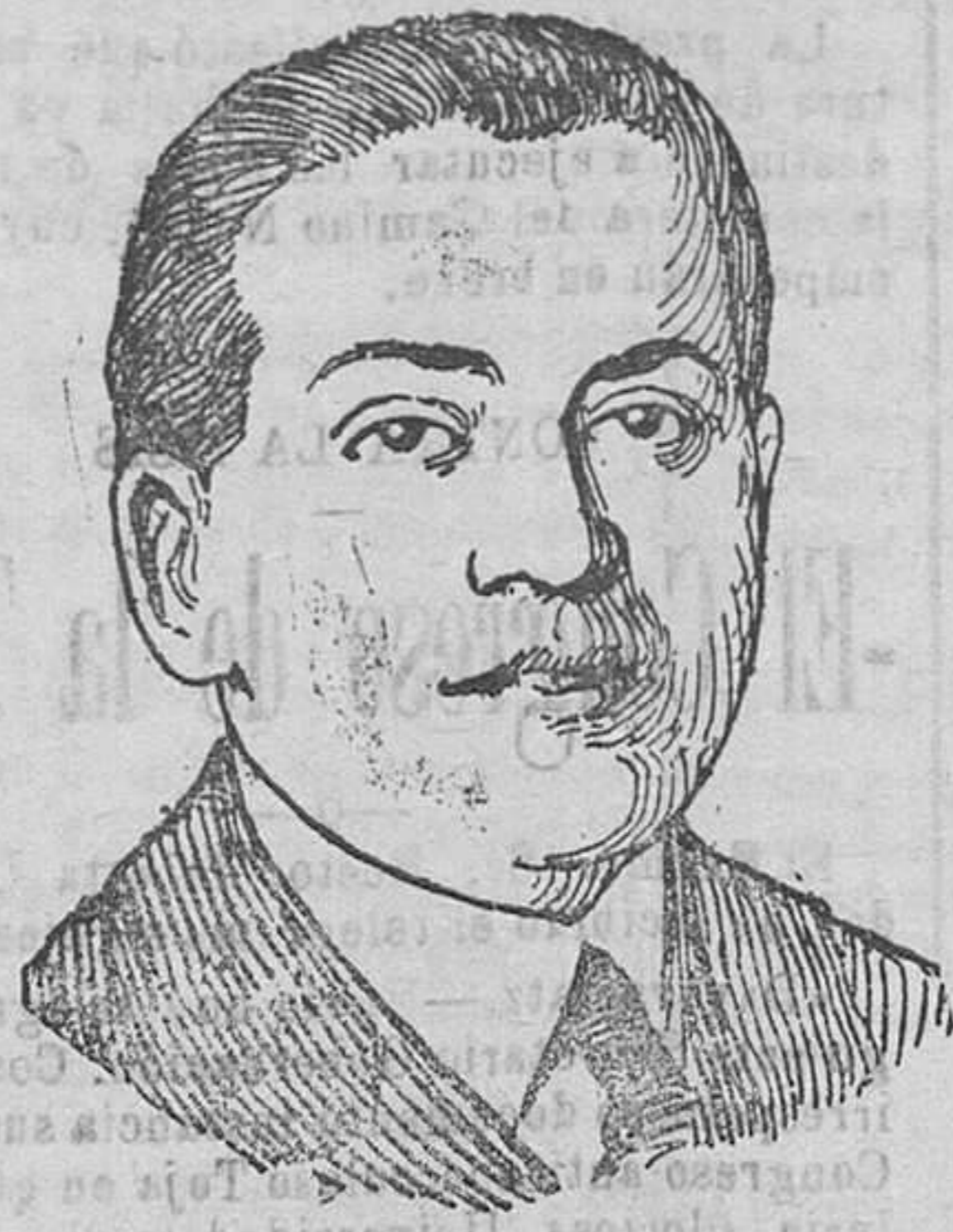
El director general de Administración local, D. José Calvo Sotelo, que ha sido designado por el Gobierno, para el cargo de gobernador del Banco de Crédito Local de España.

—Pues bien señora; cátese usted. Cree que esa sería la mejor medicina.