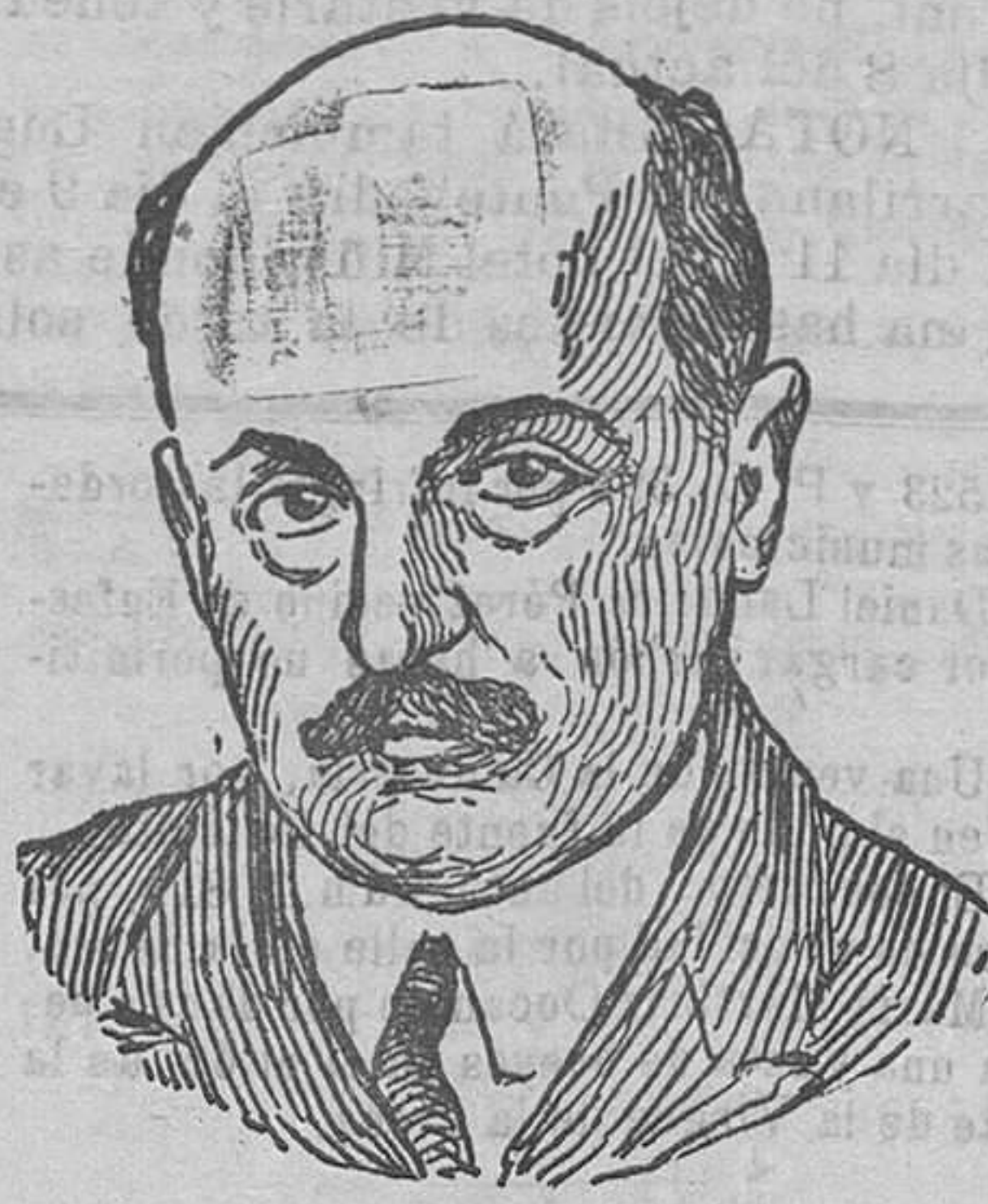
El general griego Pángalos, quien después de sublevarse contra los poderes constituidos fue nombrado jefe del Gobierno

onde viveche tanto tempo o niño, vinte pasar deixando, garimosa.