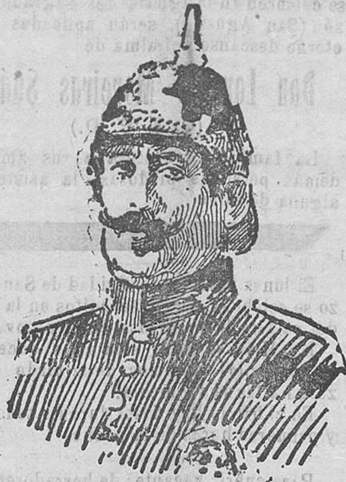
El teniente general Burguete, Director de la Guardia civil, que estos días recorre Galicia resistiendo las fuerzas de dicho instituto y que hoy estuvo en Santiago.