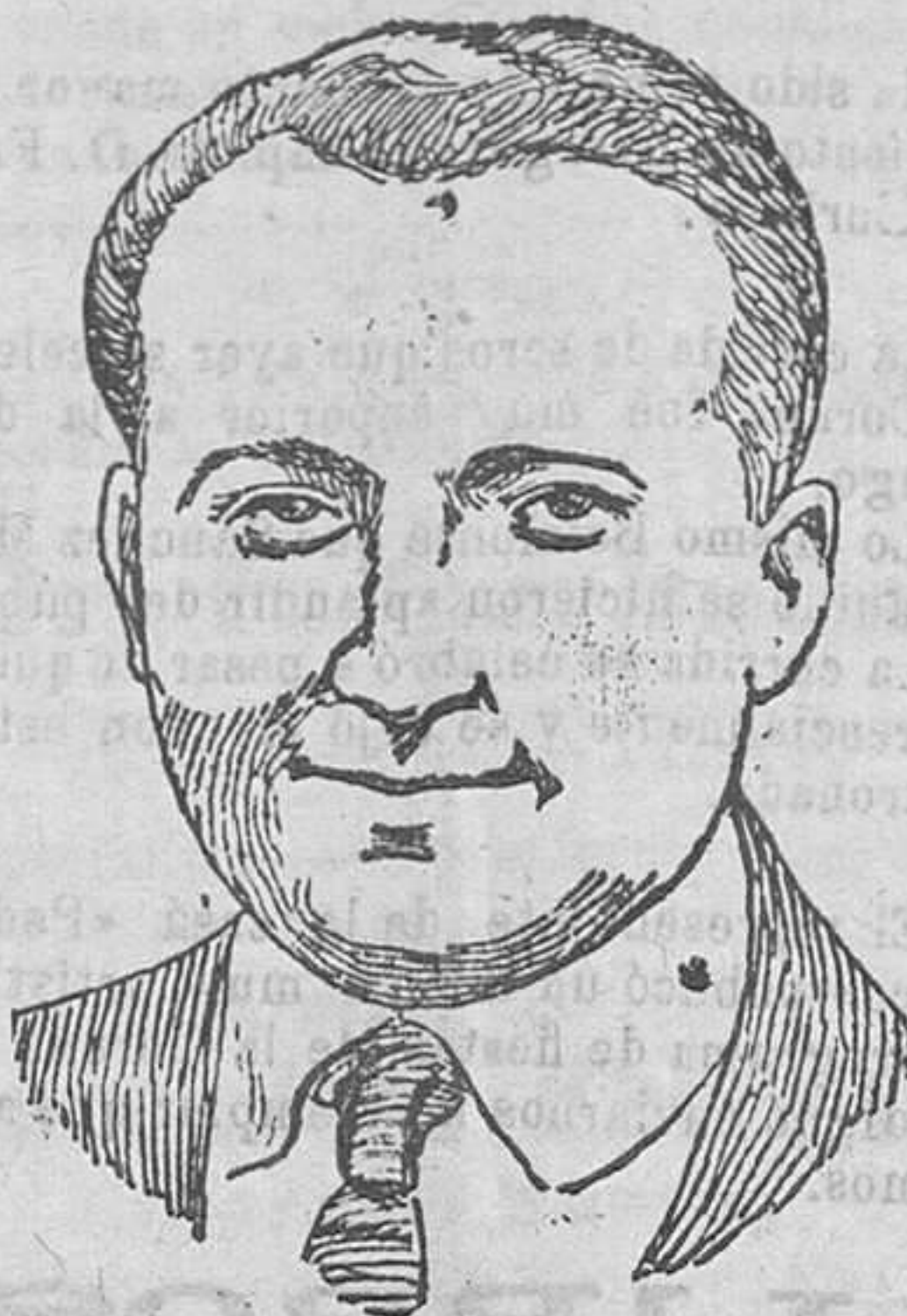
El gran aciador francés Mr. Leconte, que se ha ofrecido al ejército de su nación para luchar en Marruecos.

—gritaba un escritor—¿Qué es el público? —El público—le contestó un amigo —es la gente que no te conoce.