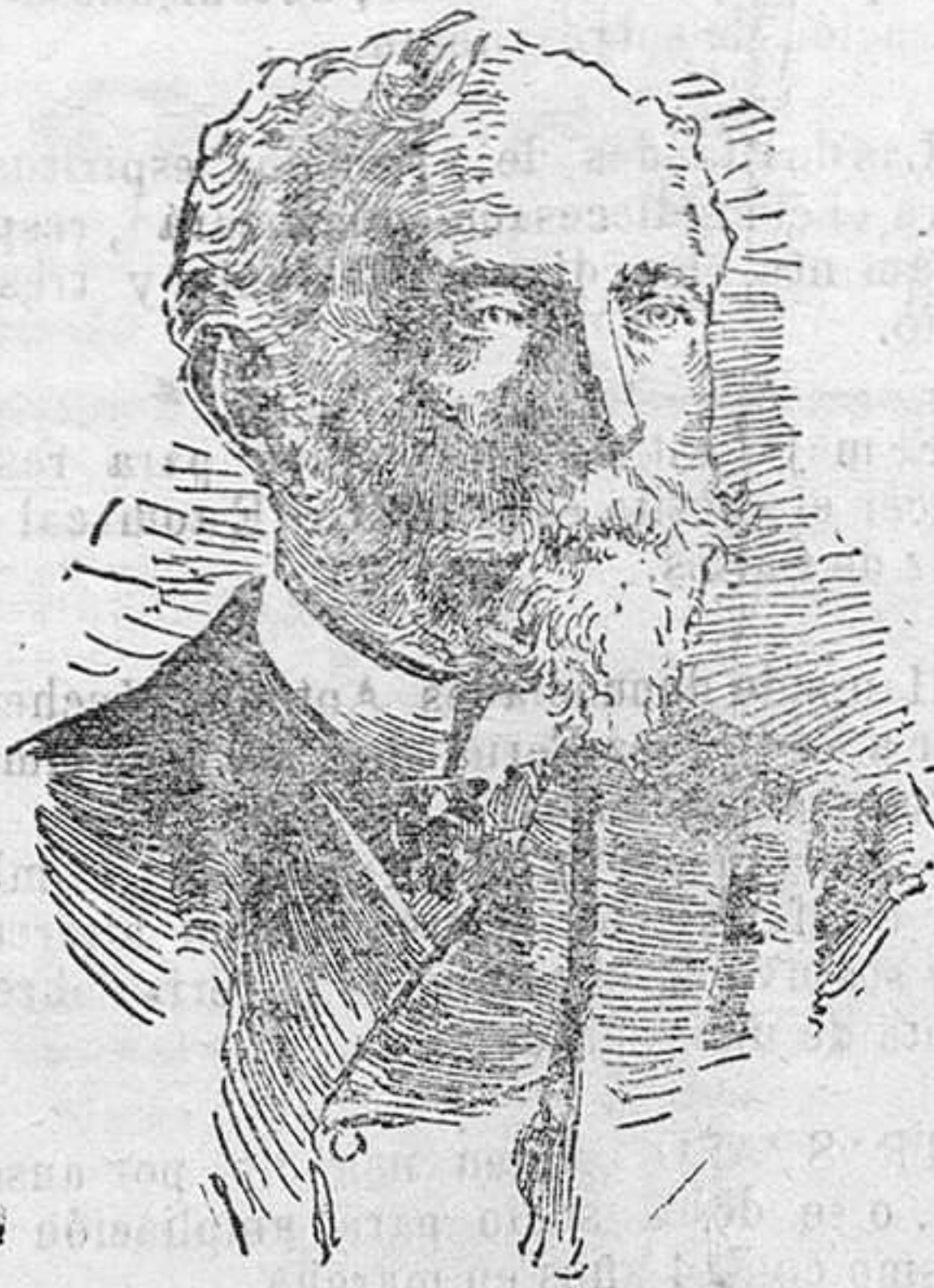
M. Pierre Paul Cambón, diplomático francés, embajador que fué en España y Londres, que falleció recientemente, causando su muerte gran sentimiento.

que satisfacen los caldos de más graduación son muy crecidos. Las conservas de pesca española podrían luchar con ventaja en aquel mercado pues las francesas, noruegas o americanas que se consumen se venden a precios muy subidos.