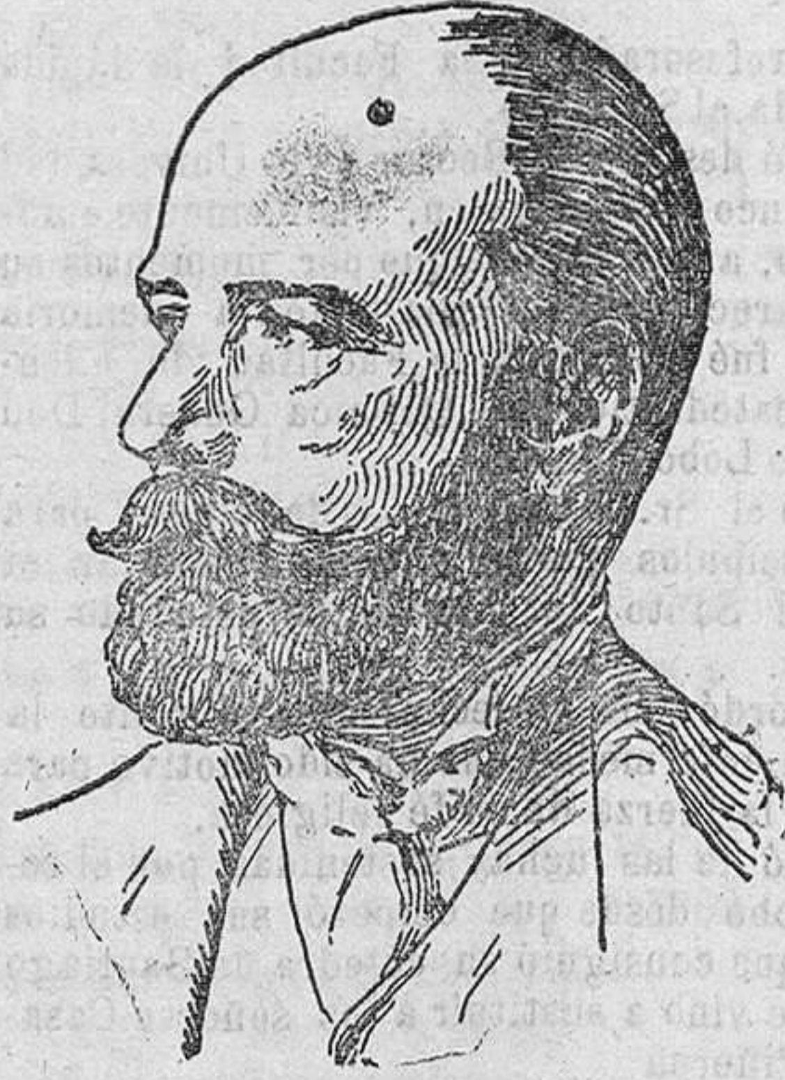
El distinguido pintor Juan Antonio Benlliure, al que el Ayuntamiento de Valencia, ha nombrado hijo predilecto, dedicándole al propio tiempo un homenaje.