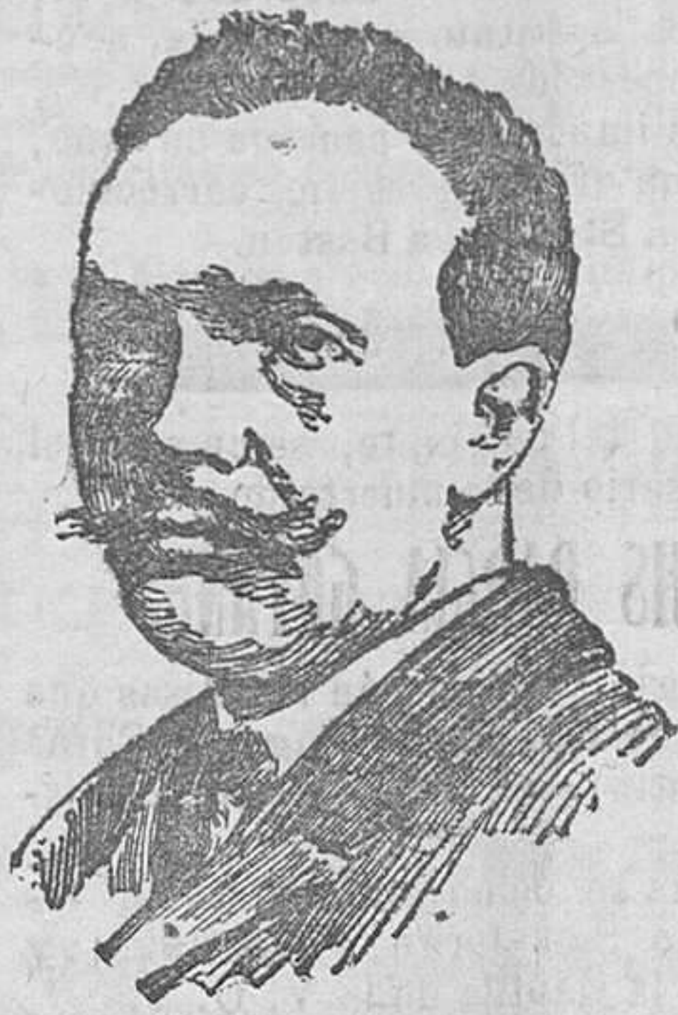
El maestro compositor D. Ricardo Strauss, que se encuentra recorriendo las principales poblaciones de Andalucía.