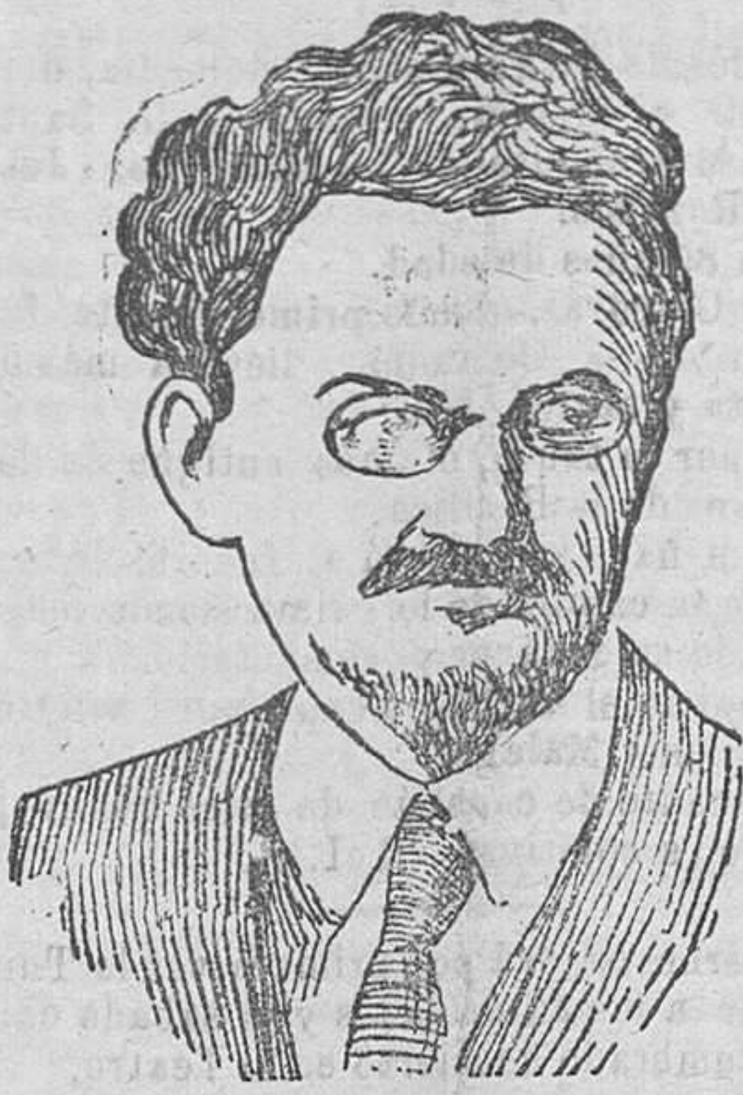
Trotsky, que ha sido relevado del cargo de jefe supremo del Consejo de Guerra de los Soviets, por el general Frunze.

siciones: abrochado, sin abrochar, sentado, de pie, etc. Aquí también unas cuantas vuelas a la idea: ¿cae bien?; es buena. Y no hay más.