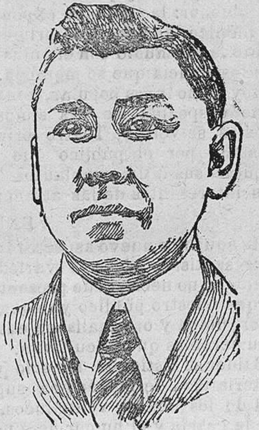
Don Adolfo de las Huertas, actual jefe de la revolución Mexicana que disputa la presidencia al General señor Obregón.