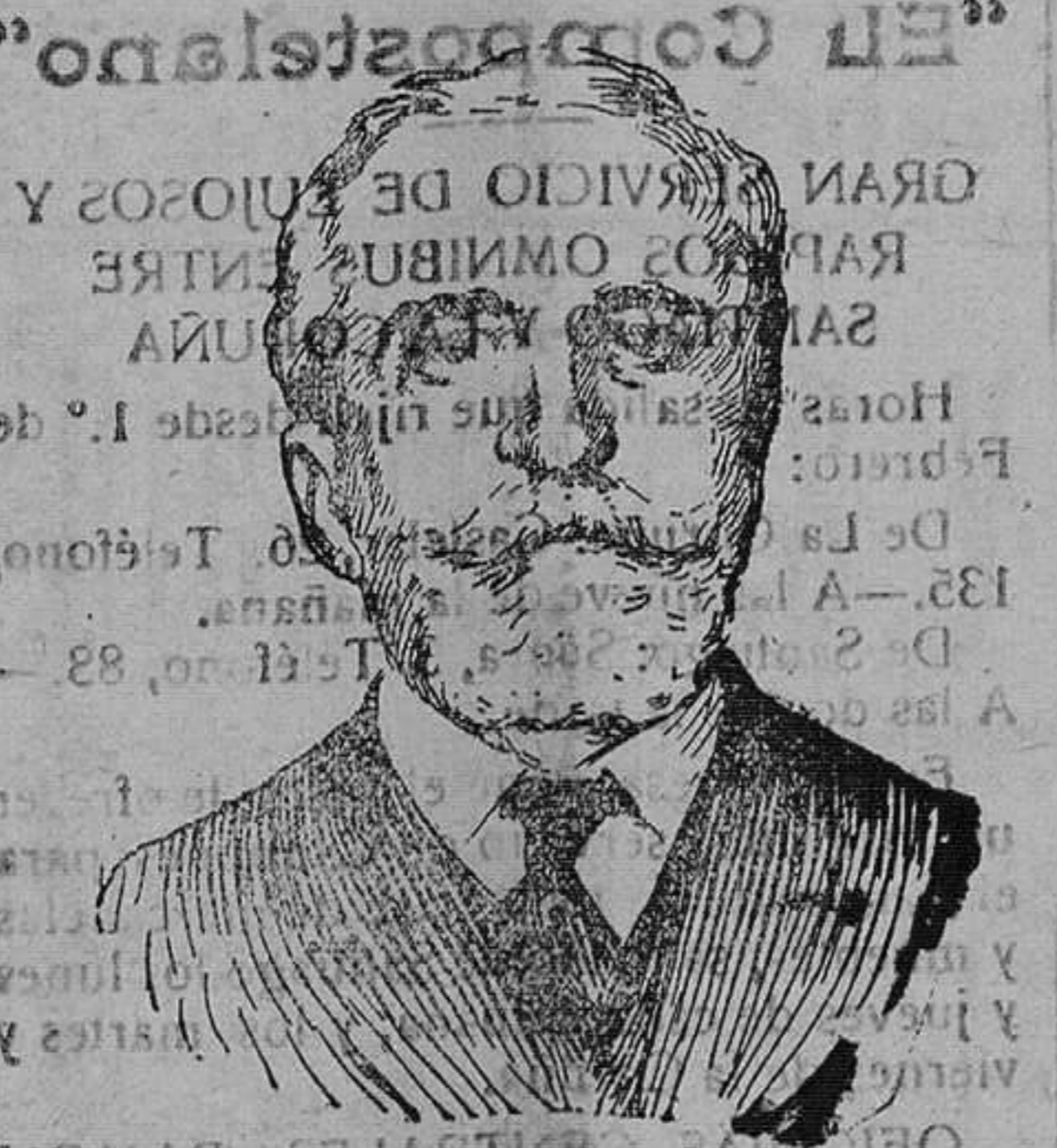
El eminente director de orquesta E. Mantovani que visitó en Roma hace pocos días.