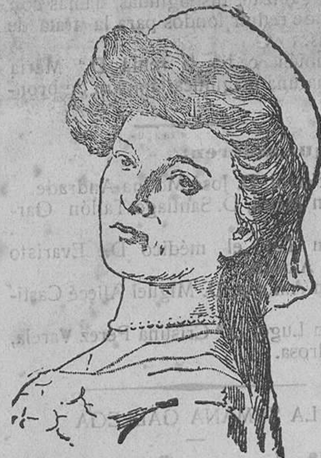
La princesa Tatiana, hija del Zar de Rusia.