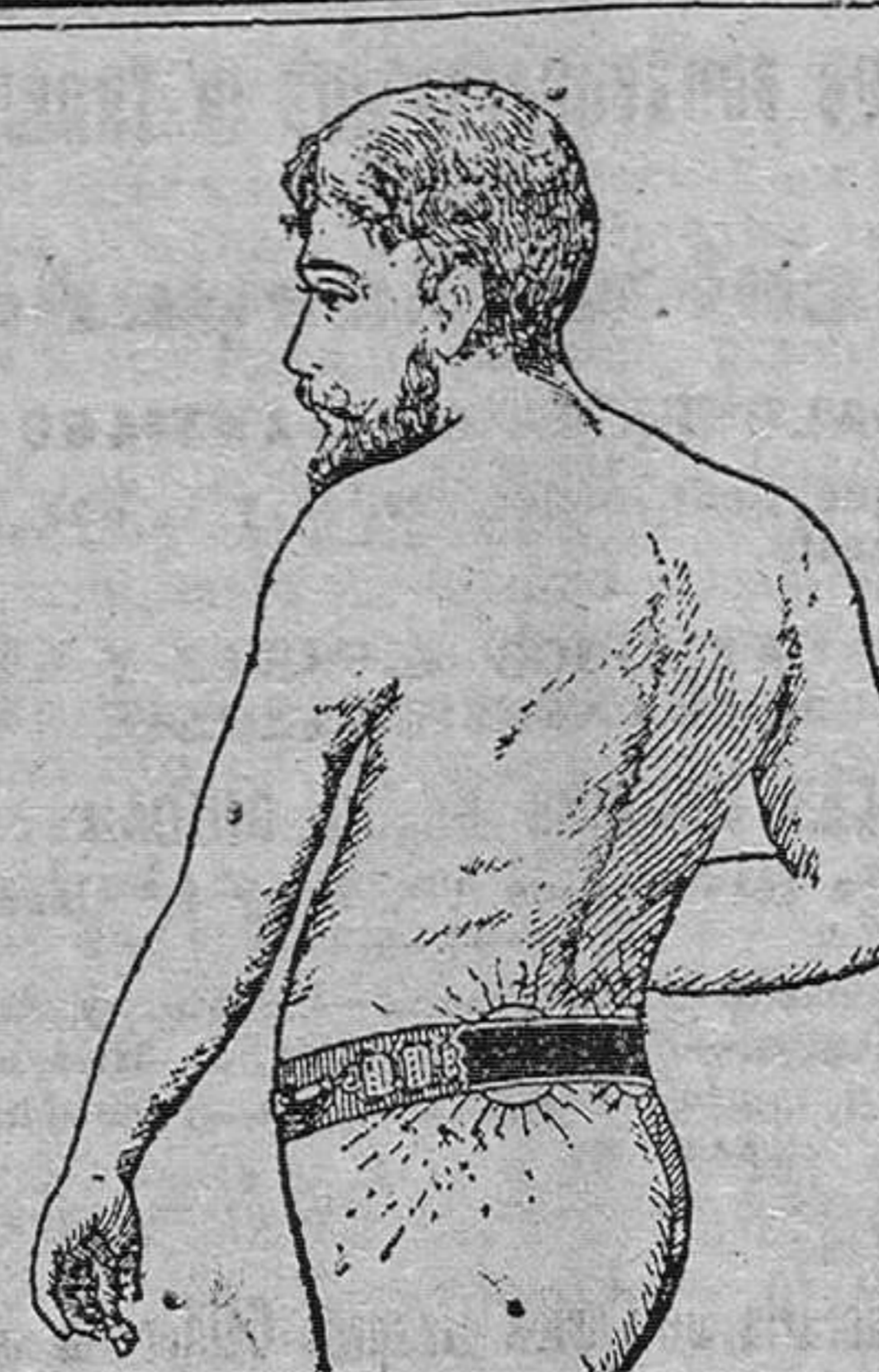
Marca registrada Núm. 28.457.

El precio del oro fué 000'00000'00 ayer de . . . . .