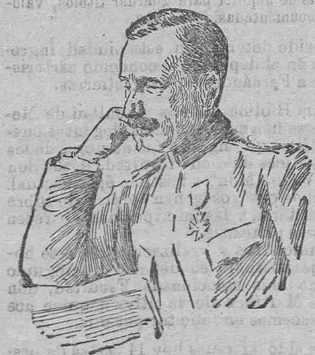
EL GENERAL JESSON