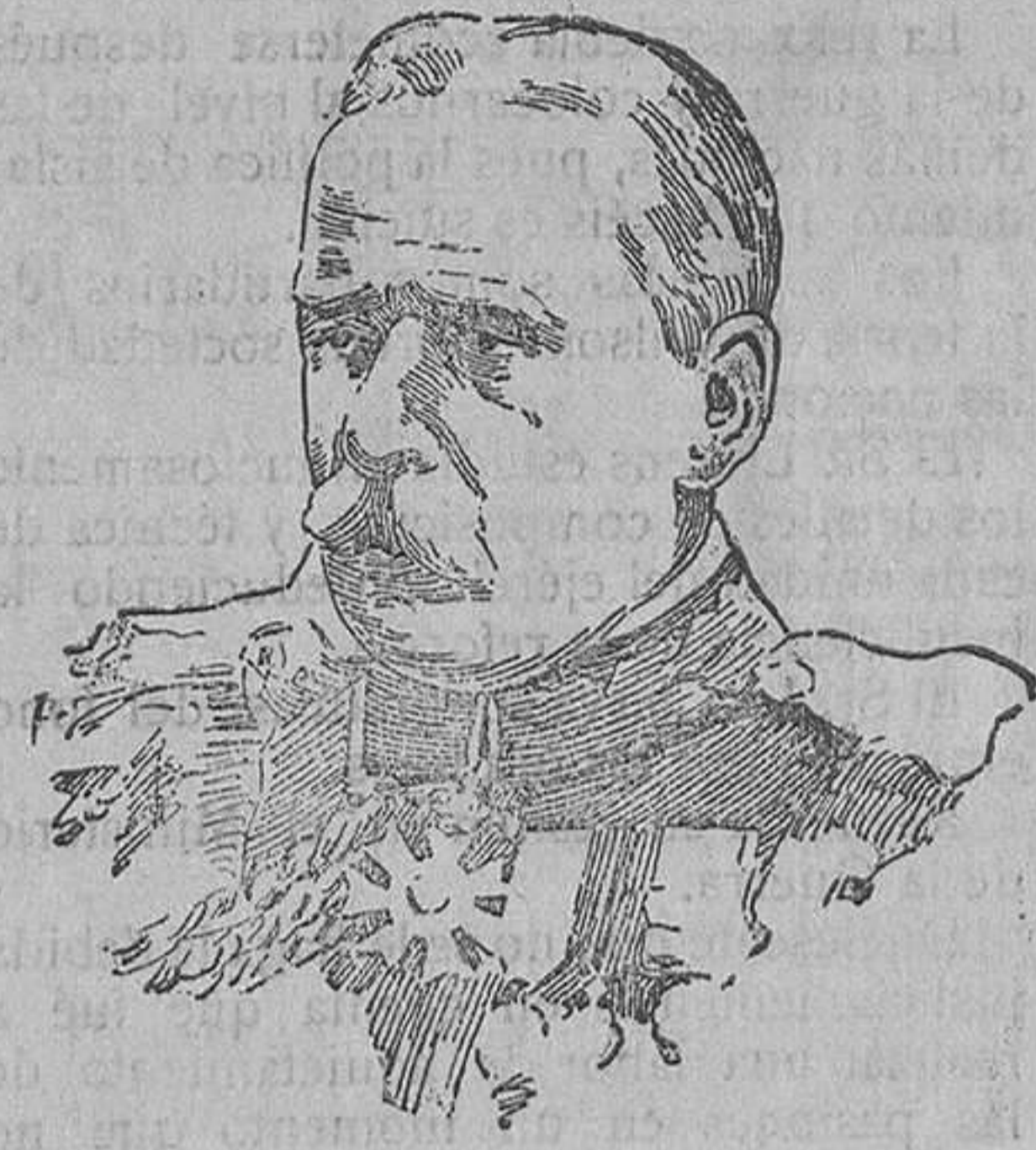
General inglés French, que por méritos de guerra ha sido nombrado virrey de Irlanda.