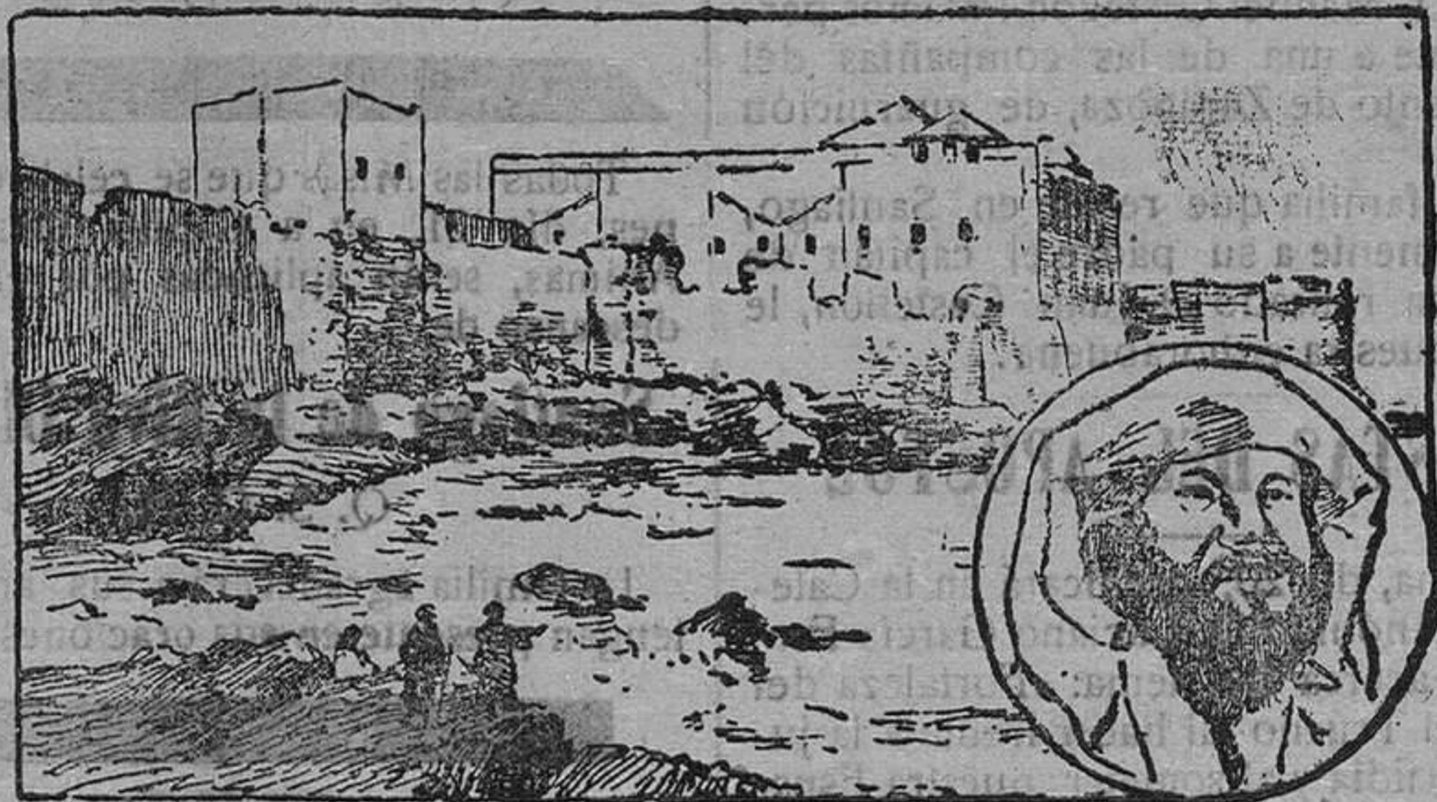
El Raisuli y su palacio fuerte en Beni-Idef.