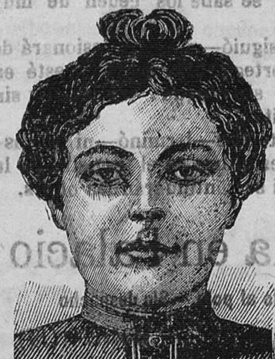
Después de 15 días de tratamiento

Hemos señalado á los lectores de este periódico el descubrimiento en lo que toca á las enfermedades de la piel. Aquí la lista de estas enfermedades que han sido curadas, después de algunos días por este tratamiento maravilloso: Ecema, herpes, impetigos, acnes, sarpullidos, prurigos, rojeces, sarpullidos laríngeos, sycoses de la barba, comexones, varices, llagas varicosas y eczemas varicosas de las piernas, enfermedades sifilíticas. Este maravilloso tratamiento ejerce su acción sobre el punto en el cual se localiza el mal, como sobre la sangre, que después de algunos días, se encuentra transformada y purificada. Todos los ensayos tuvieron buen éxito, y no se ha producido jamás una recaída después de la curación. El precio del tratamiento es proporcionado con todas las condiciones de la fortuna. (Existo también un tratamiento para los niños de 3 años hasta 16) Acaba el señor RICHELET de instalar depósitos de su tratamiento en todas las boticas y droguerías de España. Un folleto, en lengua española, tratando de las enfermedades de la piel, ha de ser remitido gratuitamente, por los depositarios, á todas las personas que lo pidan.