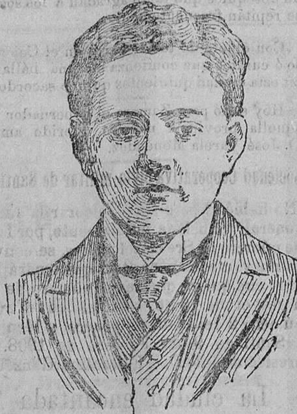
El nuevo Rey de Portugal D. Manuel II

una presa sobre la cual caer alternativa-mente, y que repartían a sus adeptos destinos y mercedes, sin tener para nada en cuenta ni la probra del país, ni el mérito ó demérito de los improvisados funcionarios.