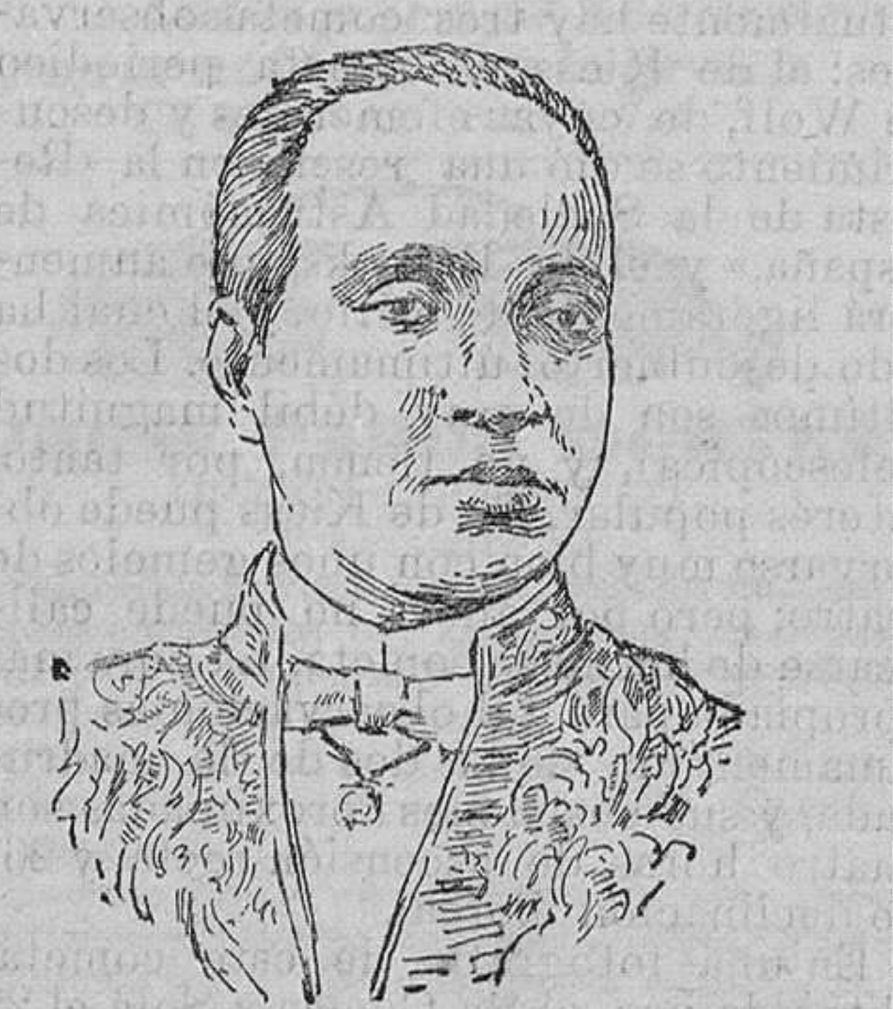
El general Firmin, jefe de los revolucionarios de Haití

VISITA CIENTIFICA El el Gobierno civil de Orense se ha recibido una comunicación del ministerio de Estado anunciando la próxima llegada a aquella capital de los profesores Wilson Alofanes, de Yena, y Muller, de Aiz-la-Chapelle. Dichos sabios alemanes efectuarán, primeramente, experimentos científicos en los ventisqueros y lagos Alpestres, y después vendrán a levantar planos topográficos de las provincias de Orense, León y Zamora. Relacionanse estos trabajos con el eclipse de sol del año próximo, que será visible en varios pueblos de las citadas provincias y tiene gran importancia por ser el último total del presente siglo.