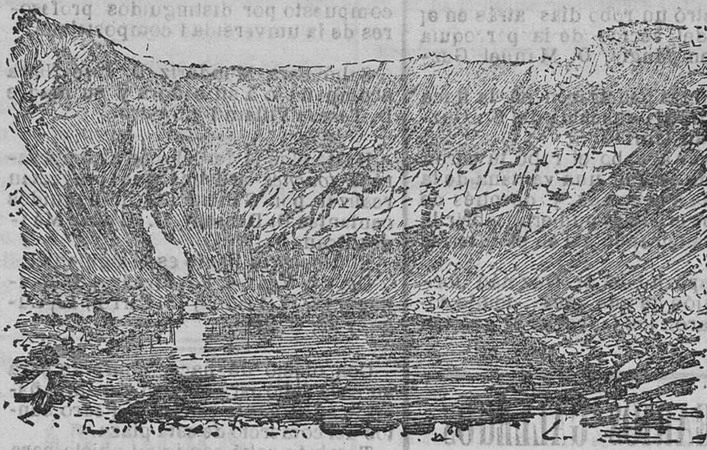
LAGUNA DE LA CALDERA

Aparte de la variedad de paisajes y accidentes del terreno, vista de ventisqueros lagunas y cascadas y otros atractivos que ofrece la excursión á Sierra Nevada, tiene ésta para el viajero tres ó cuatro impresiones distintas