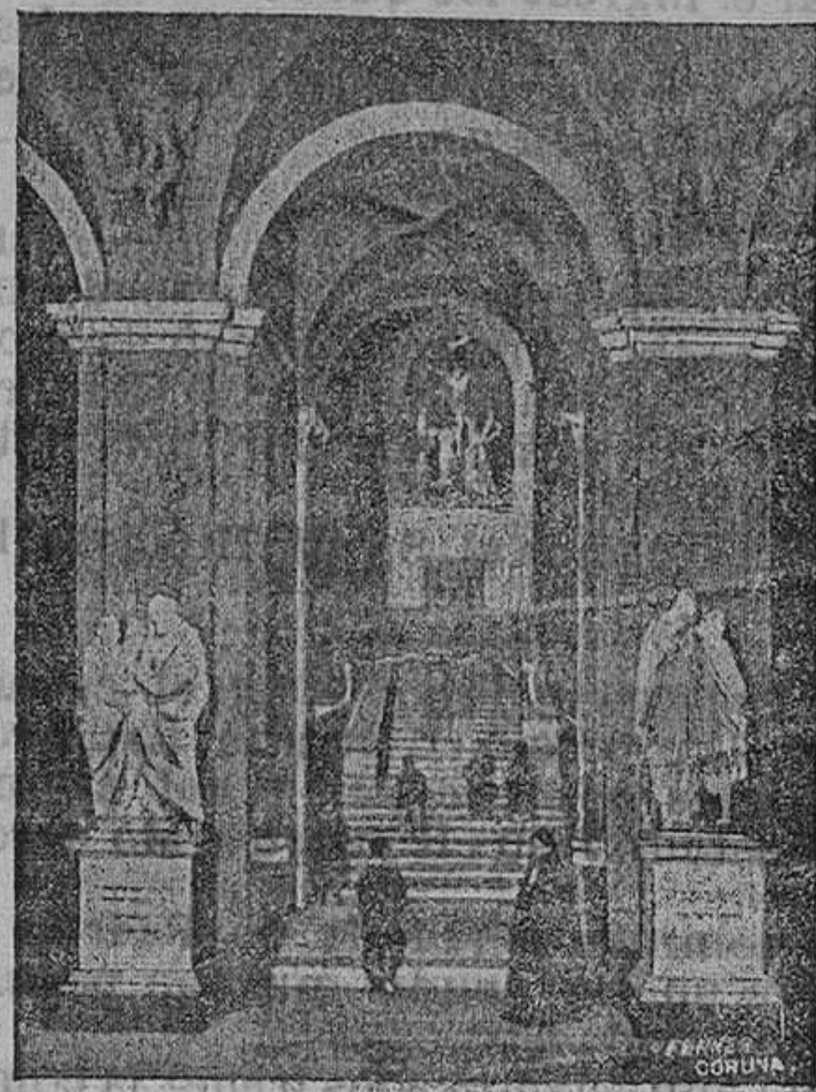
Escalera de Pilatos

Reproduce este grabado la que subió Jesús al ser conducido ante Pilatos al Pretorio.