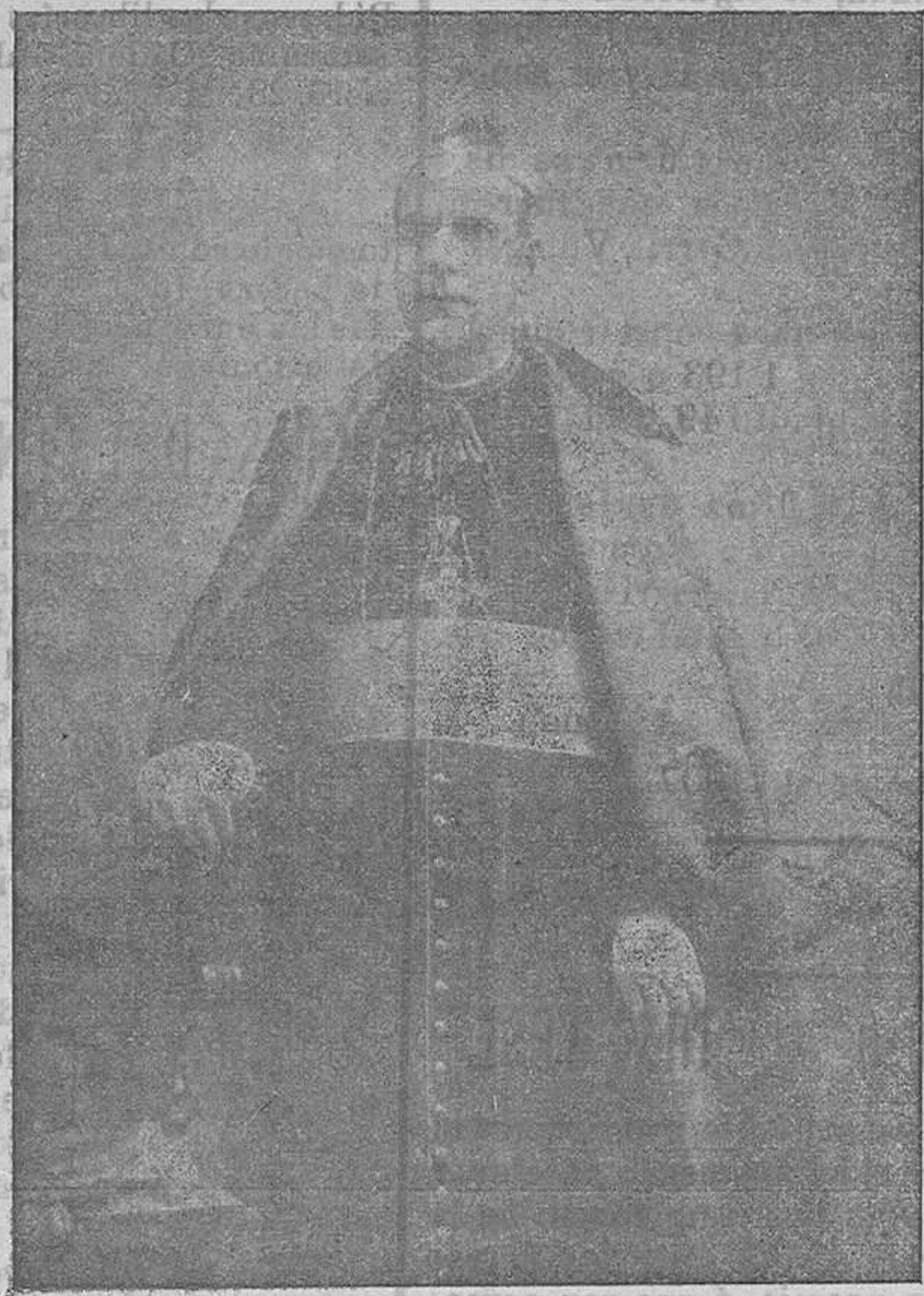
Ilmo. Sr. Obispo Auxiliar