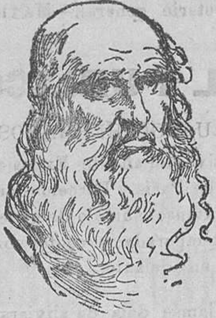
LEONARDO DE VINCI

Para presenciar la consagración del Papa León X, se trasladó á Roma, y el escaso aprecio que de su persona hicieron los artis-