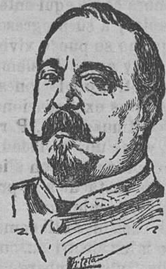
EL CONDE DE VALMASEDA

Pero Valmaseda era desafecto á este monarca, y en lugar de recibir las fuerzas que solicitaba recibió la orden para que inmediatamente se trasladara á Madrid, donde quedó de cuartel hasta que el primer Gobierno de la Restauración le envió á Cuba como capitán general de la isla y general en jefe de su ejército, coma