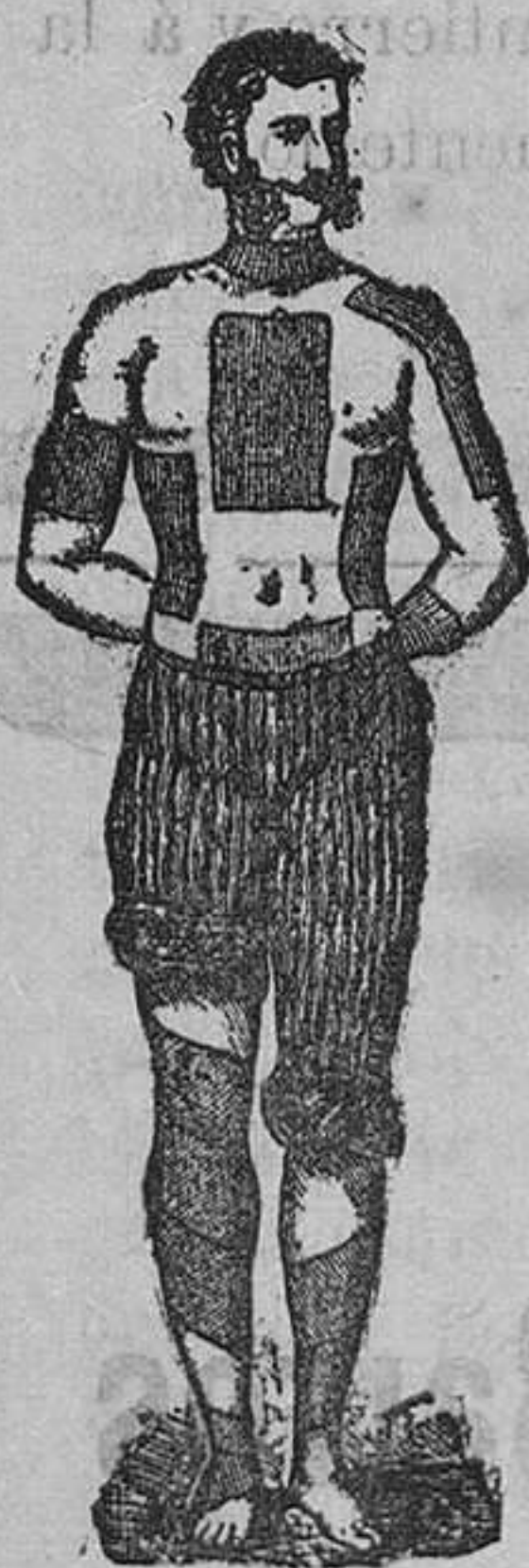
Trade Mark Registered.

CURAN REUMATISMOS, RESFRIADOS, DOLOR DE RIÑONES, DOLOR DE ESPALDA, DOLOR DE PULMONES LUMBAGO, CIÁTICA, CONTUSIONES, ETC.