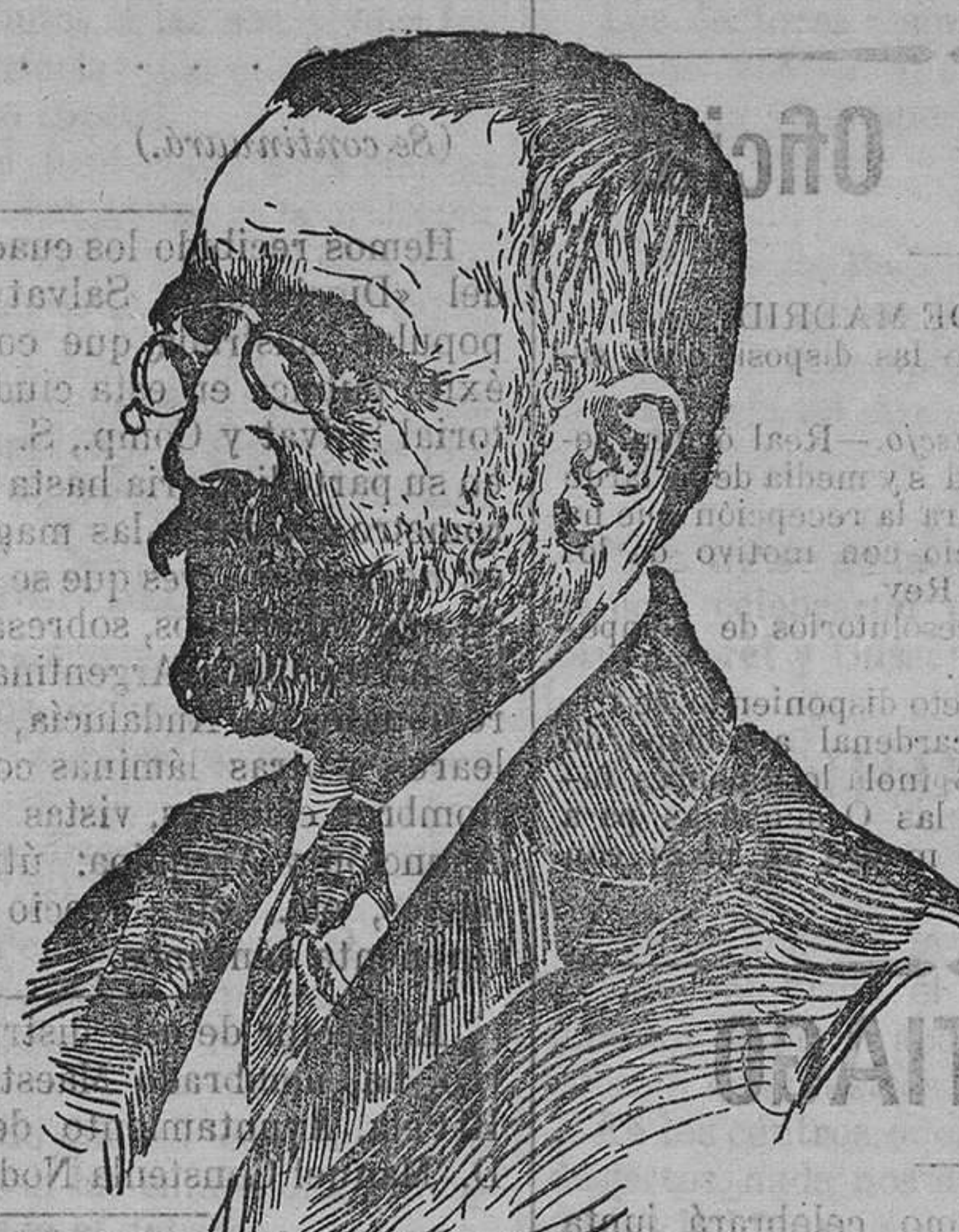
DON JOSÉ CANALEJAS Y MÉNDEZ

Como modelo de la tendencia hacia la pañería antigua y ofrécese la falda de esta otra toilette, de mañana, y que se