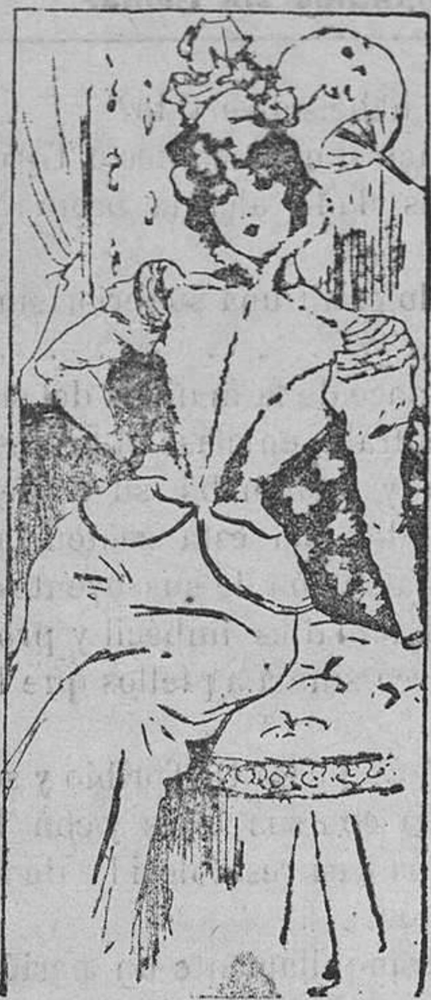
Chaqueta para paseo.

Entre las variantes que sufren de continuo las chaquetas de paño para señora, figura el modelo de la que representa nuestro dibujo. Se confecciona con biases de paño aplicado, formando con ellos dos grandes solapas. El cuello va guarnecido en su borde de caracul y las mangas adornadas con piezas de paño, tanto en los hombros como en las bocamangas.