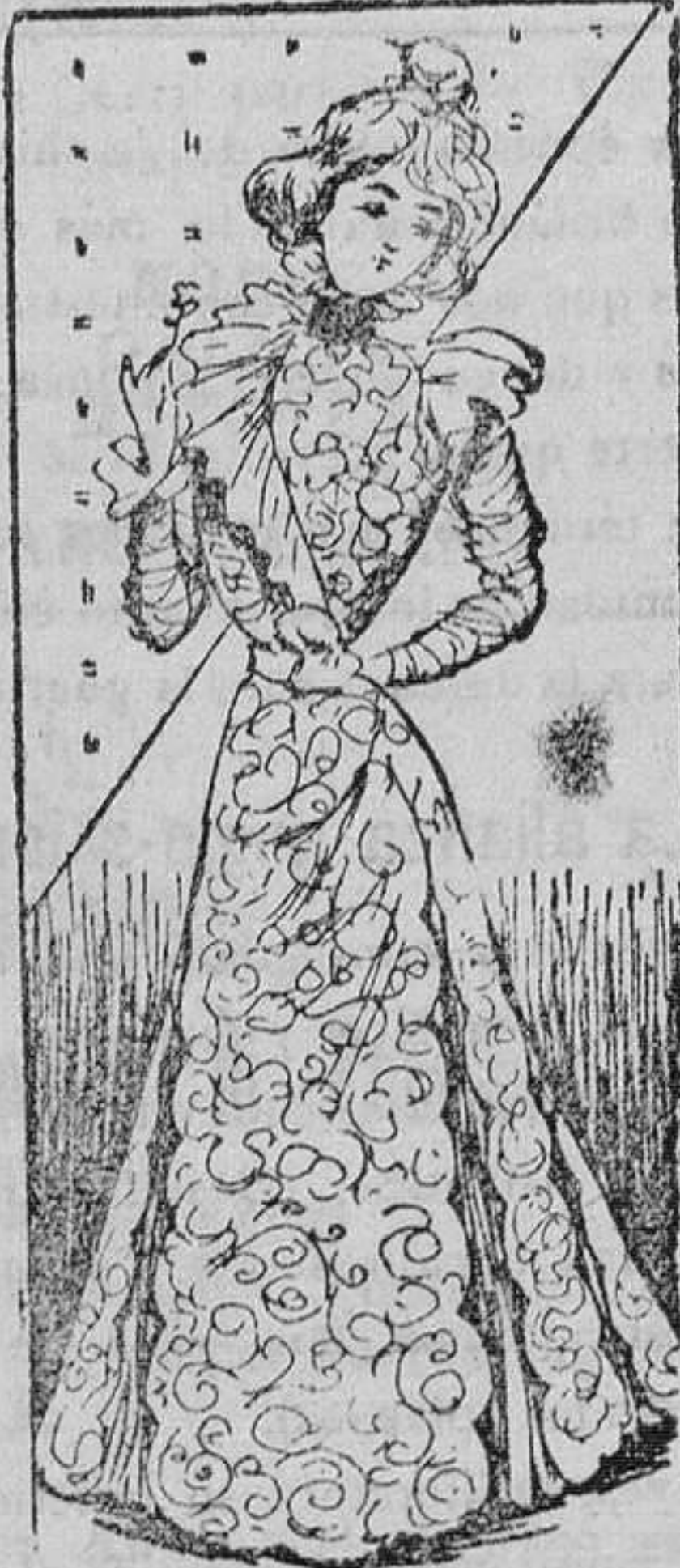
Traje para carreras

MODAS Modelos exclusivos para nuestras lectoras de los grandes almacenes de EL SIGLO.