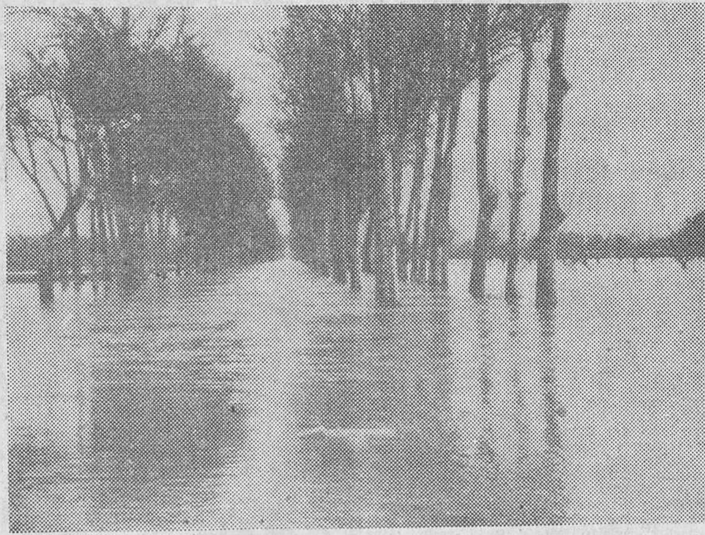
ARANJUEZ.—La carretera que une esta población con Colmenar, completamente inundada por las aguas desbordadas del Tajo