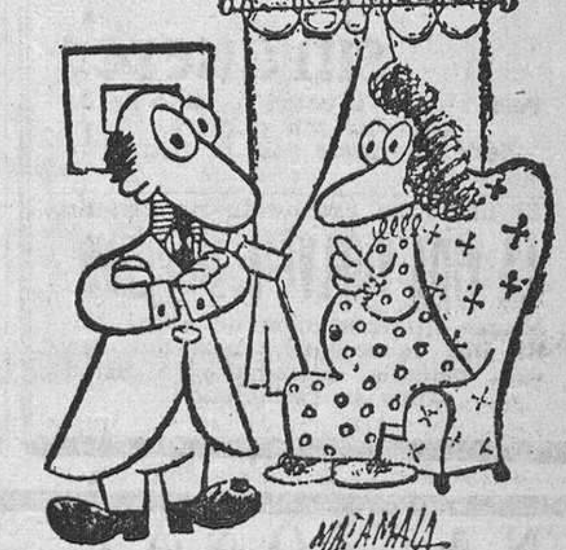
—Señorita: le ofrezco a usted mi nombre, mi fortuna, mi corazón y un piso de cincuenta duros sin traspaso.