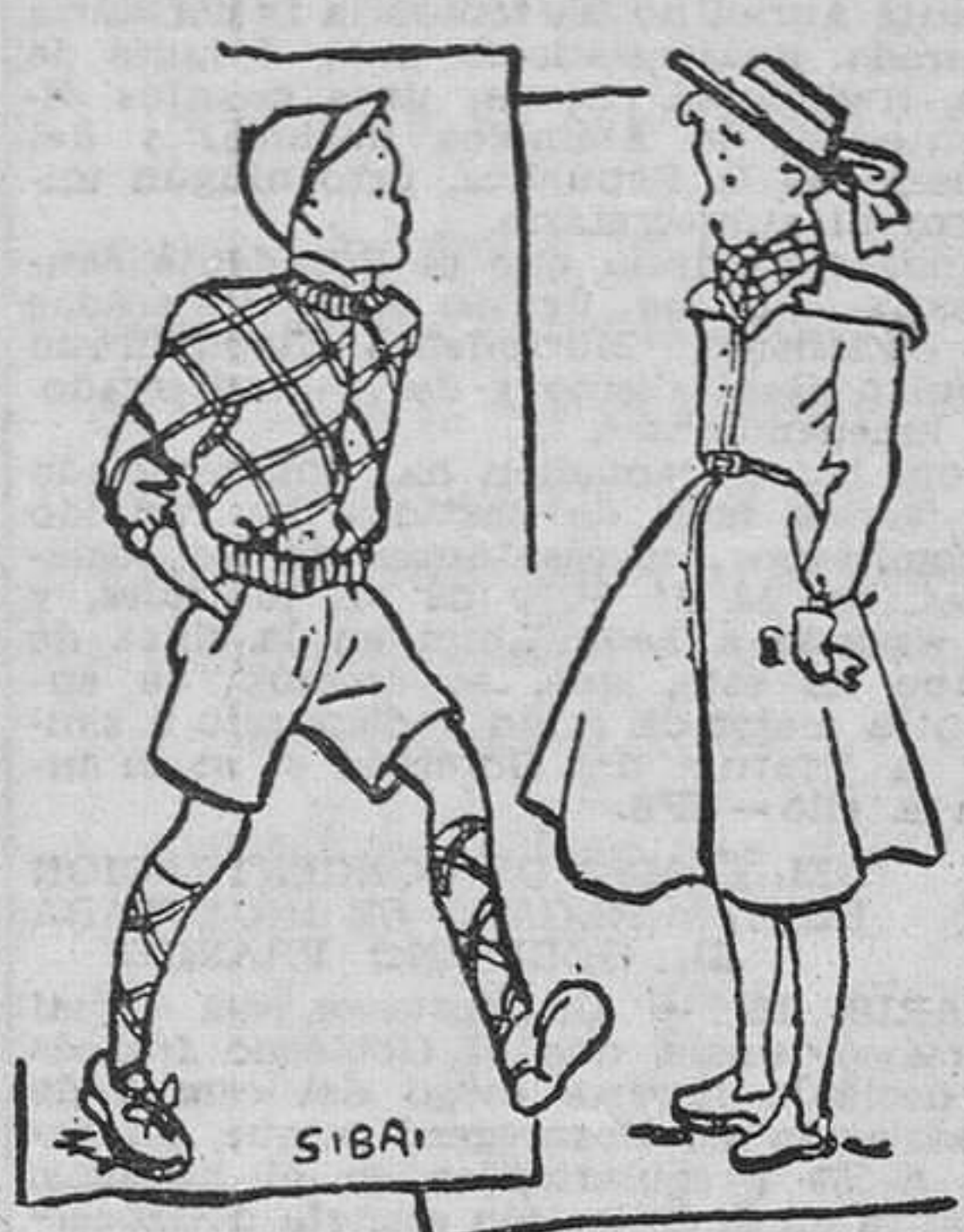
Chaqueta para chico, en paño escocés rojo y verde esmeralda. Puños y cinturilla de punto verde. Cerrado con cremallera. — Abrigo con pelerina en paño color paja. Puños de punto de media, en el mismo tono. Sombrero marrón con cinta del color del abrigo. Pañuelo en marrón y paja.