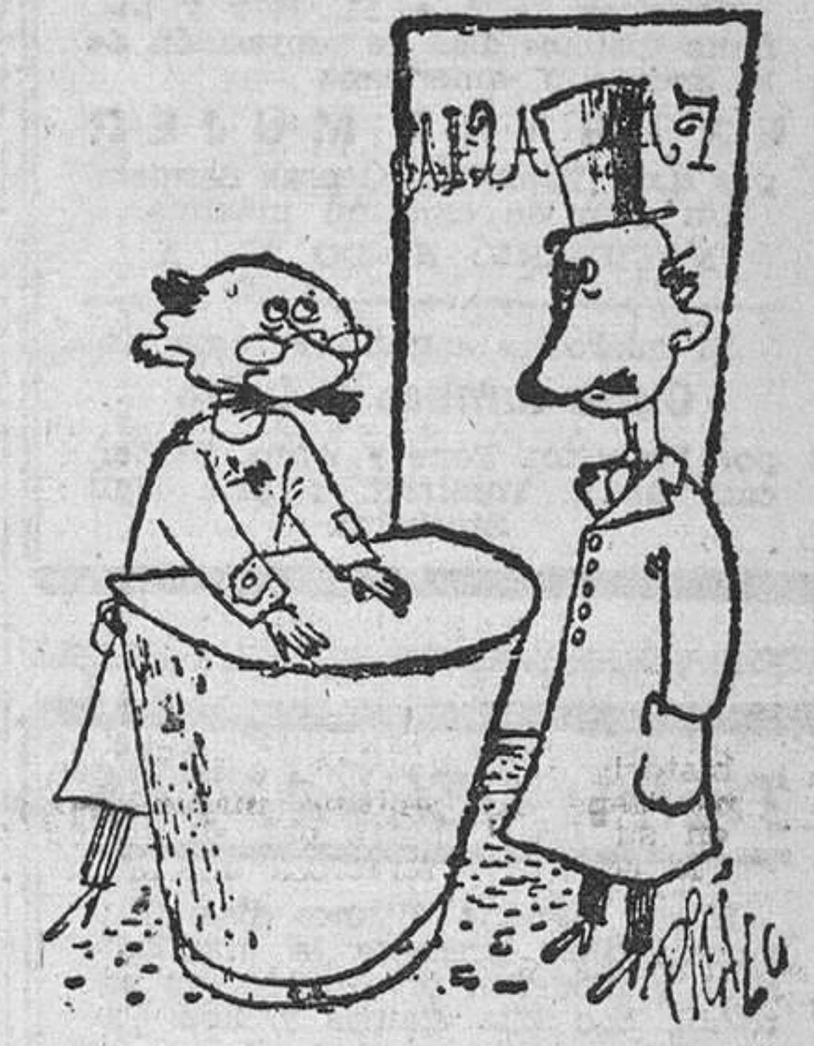
—¿Tiene usted algún específico para quitar el apetito? ¡Está todo tan caro!