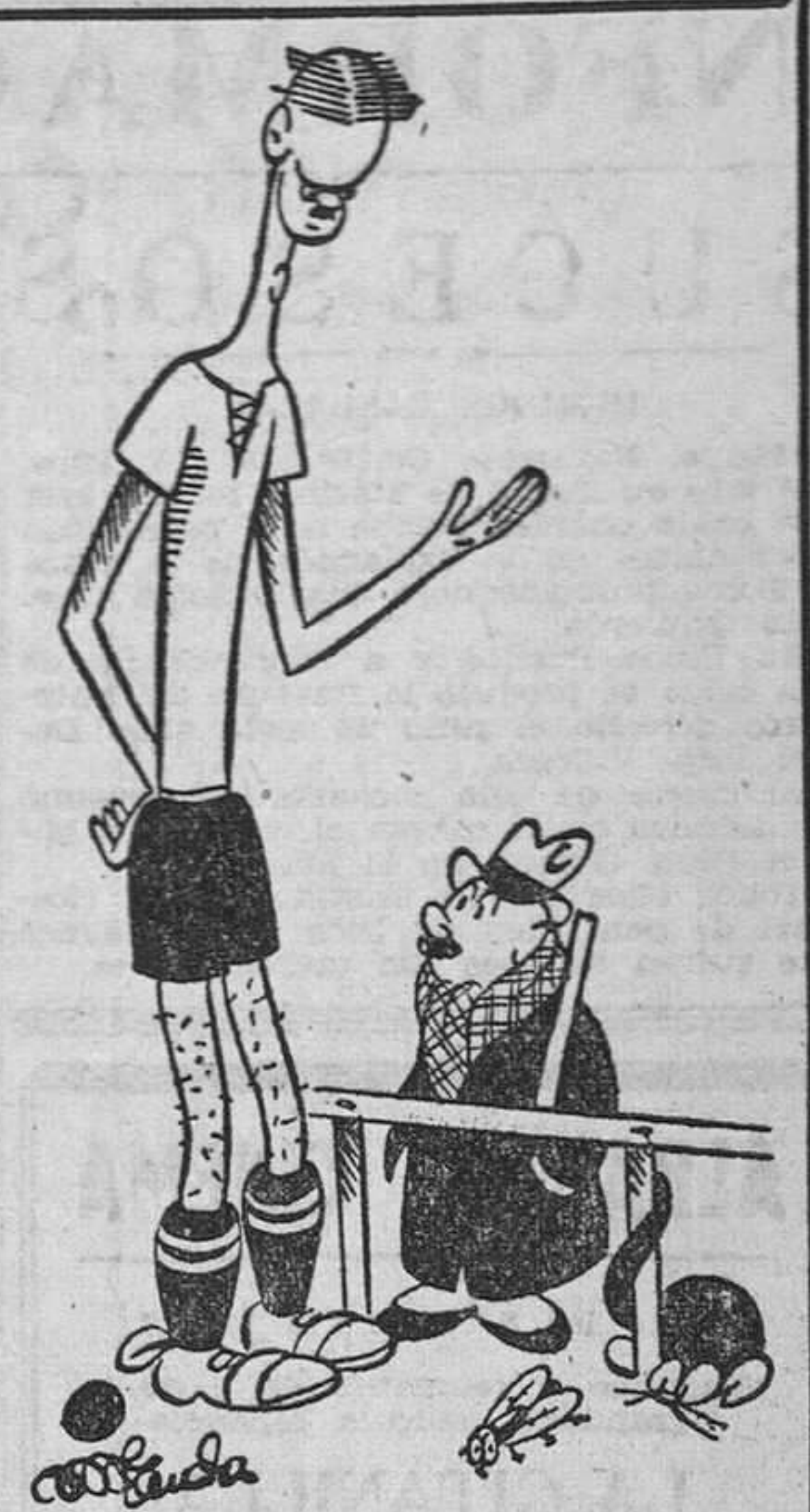
ACLARANDO, por Miranda —¿Usted es el capitán del equipo? —No, señor. Yo no soy nada más que «medio».

TRIESTE, 16.—Noticias de Capo D'Istria indican que los yugoslavos siguen desmantelando el trasatlántico italiano «Rex» y han obtenido materiales por valor de 500 millones de liras. Desde que el «Rex» fue incluido en la lista del botín de guerra aliado, ha sido causa de múltiples protestas diplomáticas.—EFE.