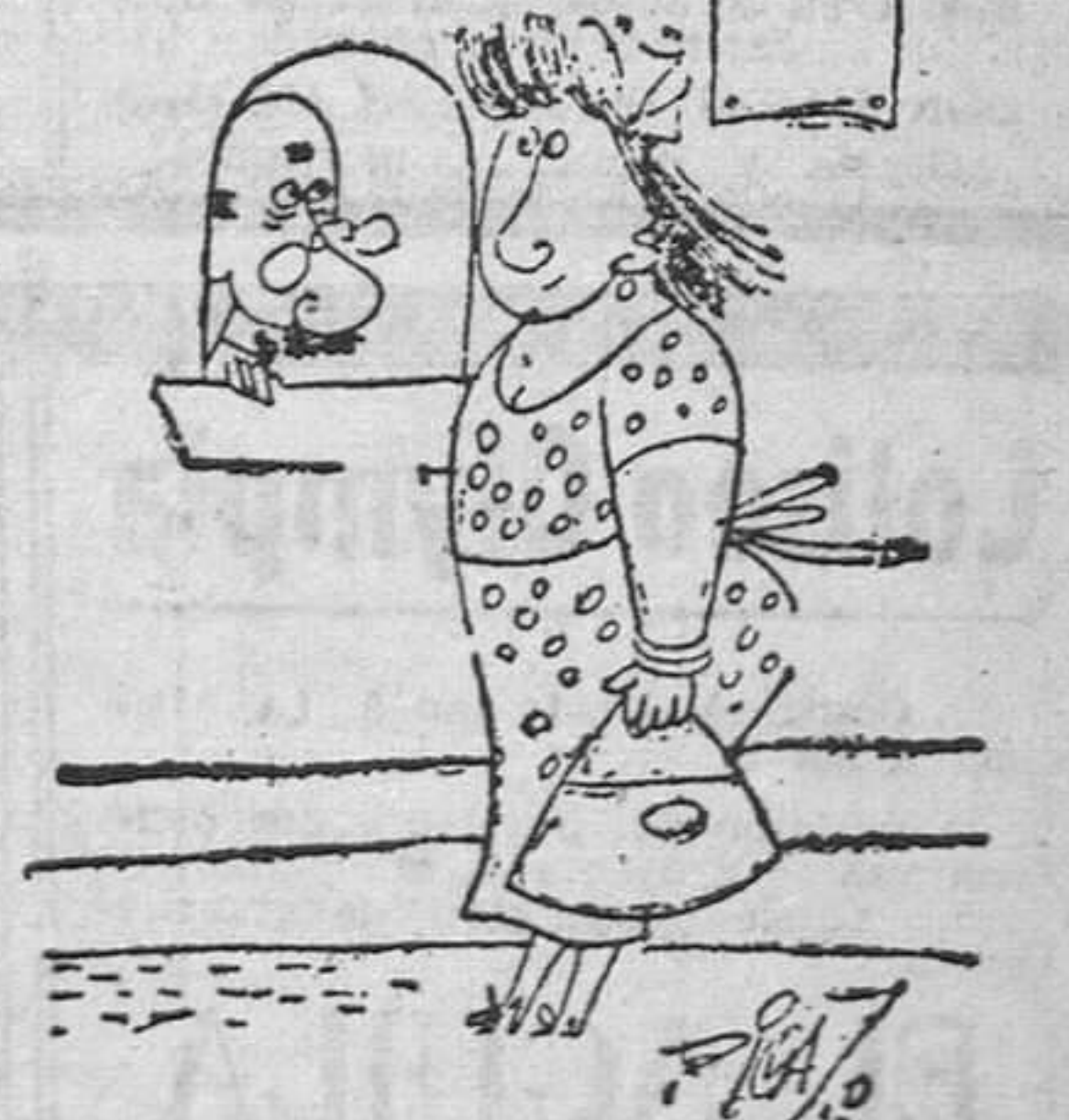
—Deseo una criada honrada, callada, trabajadora y limpia. —Entonces, lo que necesita usted son cuatro criadas.