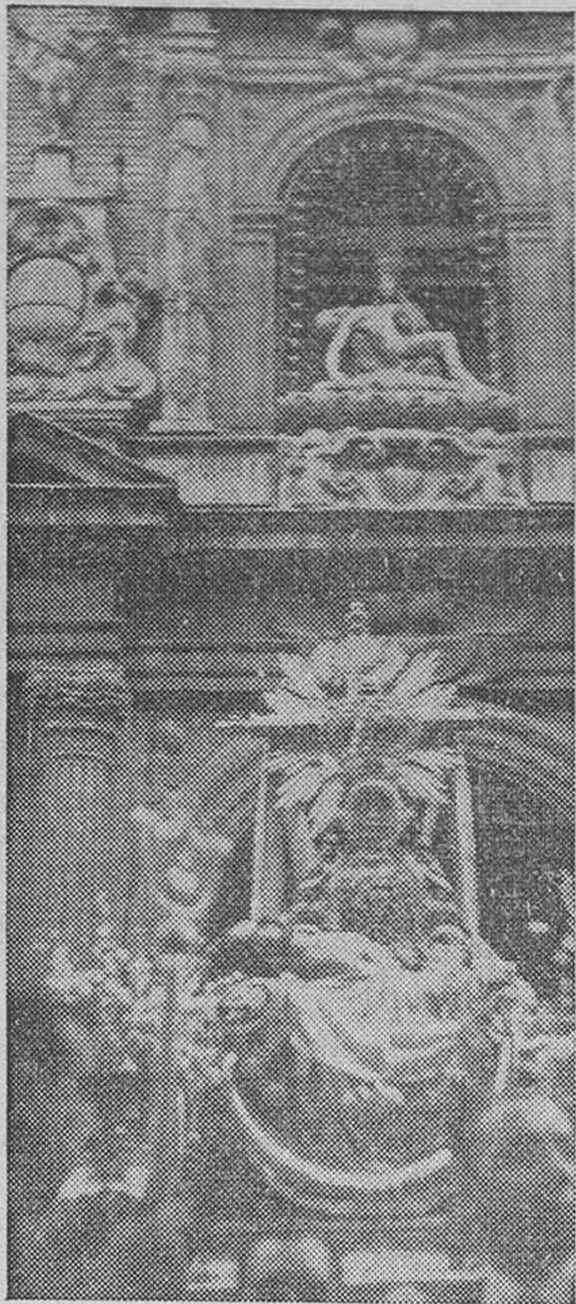
Virgen de las Angustias de Granada, ya que tenemos noticias de que la obra progresa a paso acelerado. Oportunamente tendremos al corriente a nuestros lectores sobre este interesante asunto.»

Las noticias precedentes, al ser conocidas en Buenos Aires por la colonia granadina produjeron inmenso júbilo. De ello da idea el número de la revista «Hogar Andaluz» del pasado marzo, que al dar cuenta de la fausta nueva bajo el título de «La Virgen de las Angustias en Buenos Aires», junto con una fotografía de nuestra amada Patrona, escribe: «Como verán nuestros lectores, pronto, muy pronto, quizás para nuestras próximas fiestas patronales, tendremos en Buenos Aires una exacta reproducción de la