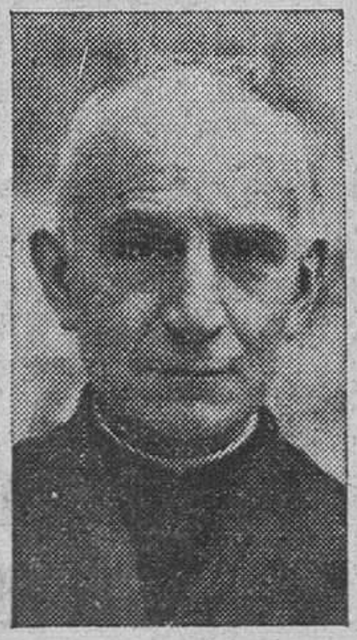
Don Angel Herrera

Para la diócesis de Málaga ha sido designado el reverendísimo señor don Angel Herrera Oria, una de las mentes más privilegiadas de España y cuya recia personalidad despierta en nosotros verdadera reverencia. Caso el suyo de excepcional apostolado y de vocación insuperable. A él se deben, sin duda alguna, la mayor parte de las organizaciones católicas que hoy gozan de honda raíz en toda España y que, en su desarrollo, tienen la especial significación del apostolado seglar incorporado a las altas tareas de la Iglesia en la hora presente. En la Acción Católica española hay claras huellas de su capacidad organizadora e intelectual. Maestro de periodistas, dió vida e impulso al gran diario madrileño «El Debate», cuyas columnas fueron vigia permanente de los derechos de la Iglesia y de los católicos en turbulenta época. Ordenado de sacerdote en Friburgo hace siete años y tras una virtuosa, ejemplar y fecunda actividad como párrroco en Santander, don Angel Herrera es exaltado al episcopado español. Orador profundo y sociólogo eminente, en la diócesis hermana de Málaga, dejará sentir su bienhechora influencia, presidida e inspirada por una vida singular de total dedicación a Dios.