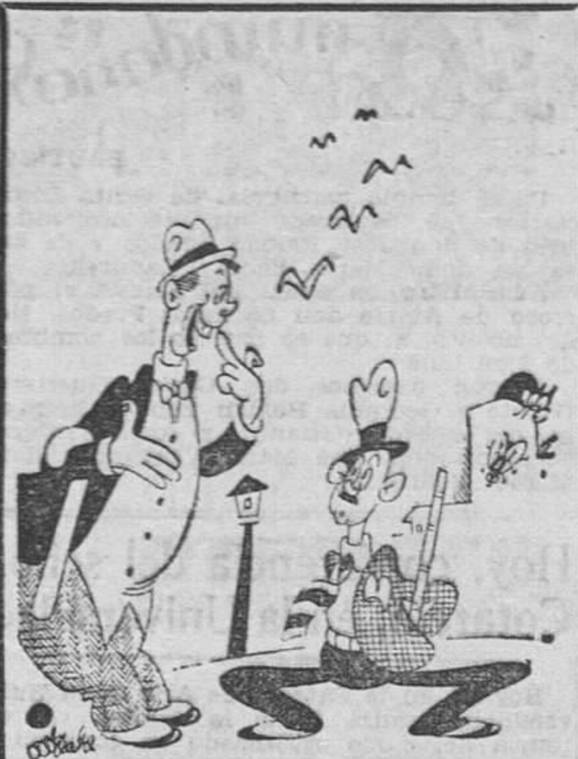
TAURINA, por Miranda

SEVILLA, 27. — En las próximas horas abandonará el puerto sevillano el yate argentino «Gaucho», para rumbo a Palos de Moguer, y desde allí saldrá siguiendo la