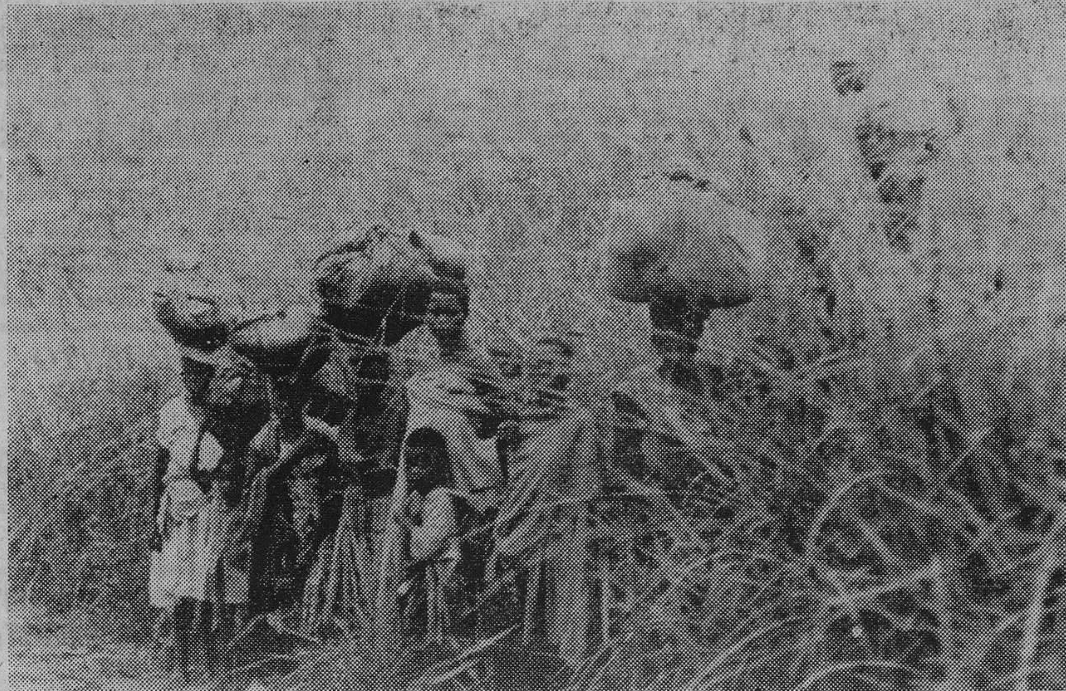
El terror ha desplazado a más de ciento treinta mil angoleños hacia zonas tranquilas, lejos del terrorismo. En la foto, un grupo de indígenas que huyen con sus enseres hacia la paz y la seguridad