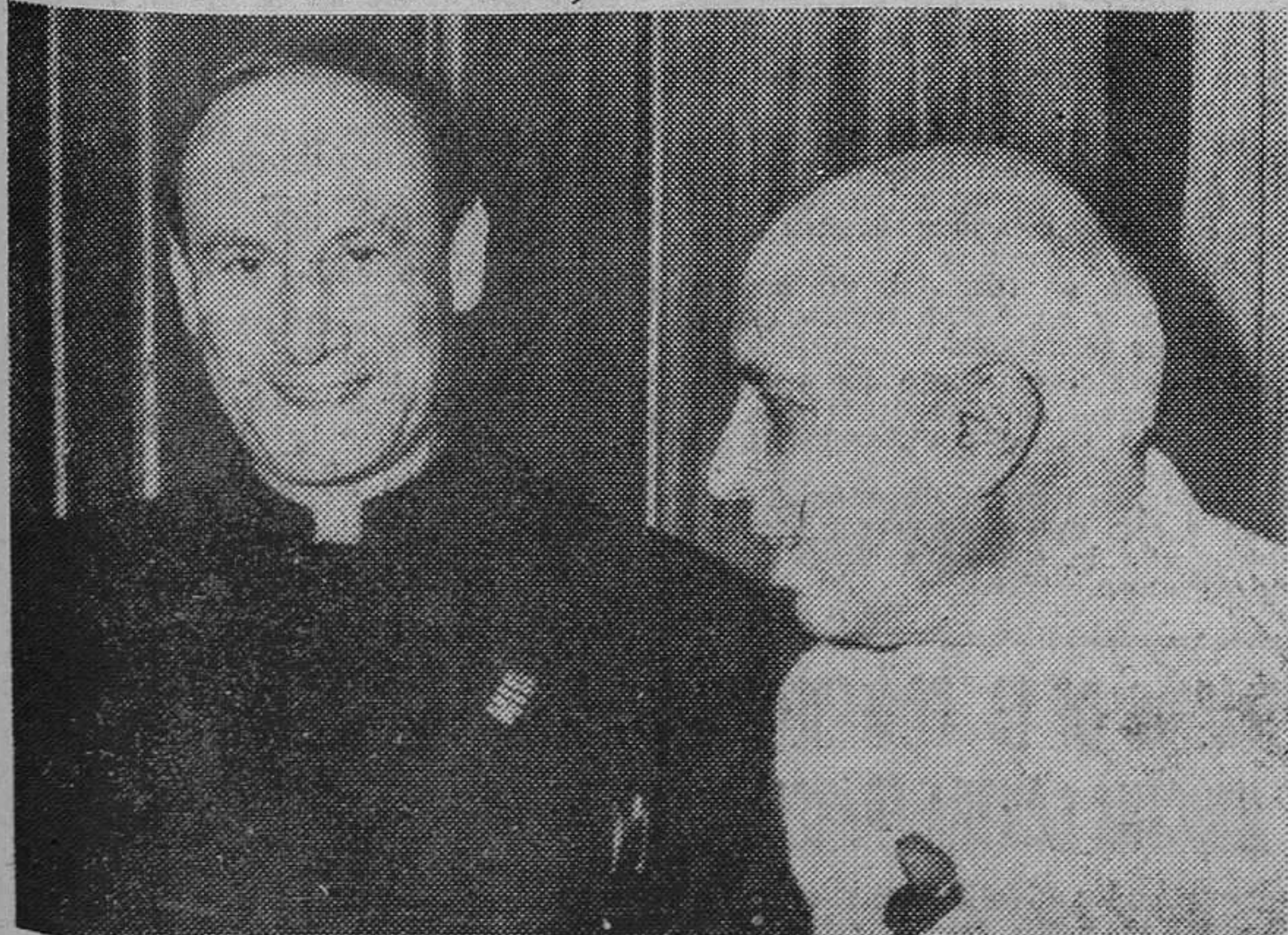
El padre Pire, premio Nobel de la Paz, durante su entrevista con el primer ministro indio, Mr. Nehru. El padre Pire llegó a la India procedente de Tokio, con motivo de su visita privada a aquel país, de una semana de duración, y para entrevistarse también con el presidente Rajendra Prasad

CALIDADES, las mejores. En precios no hay quien nos gane, porque vendemos