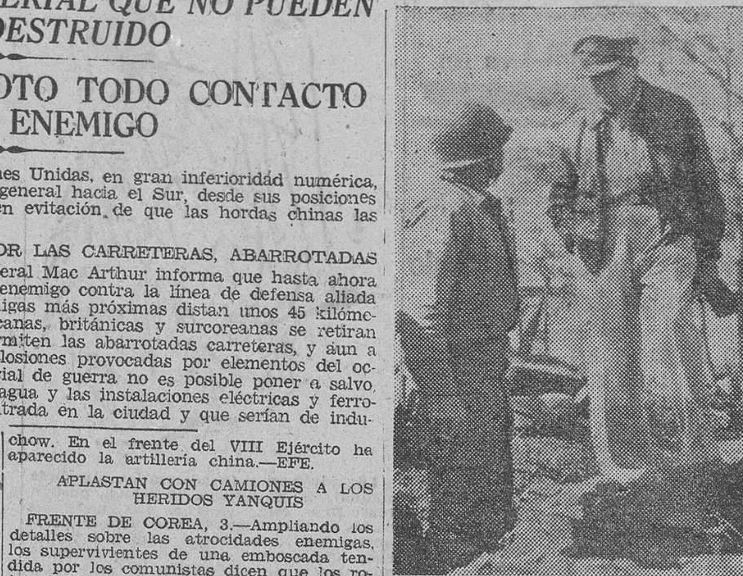
El general Douglas Mac Arthur charla con un sargento de transmisiones durante su última visita al frente de Corea