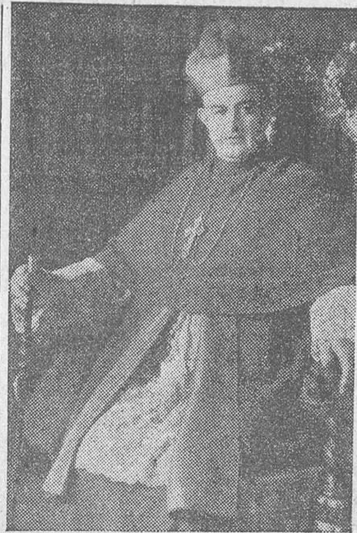
EXCMO. Y RVDMO. SEÑOR ARZOBISPO DE GRANADA

El señor Arzobispo se trasladará hoy por la mañana al pueblo de Chauchina, donde a las ocho y media oficiará el Santo Sacrificio de la Misa en el convento de Madres Capuchinas de aquel pueblo, en cuyo monasterio bendecirá el nuevo camarín de la Virgen del Pincho y concurrirá a otros actos organizados con motivo de cumplirse las bodas de plata de la fundación de