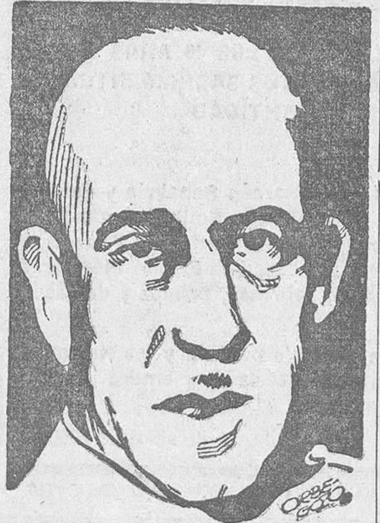
GENERAL Sr. ESTEBAN-INFANTES