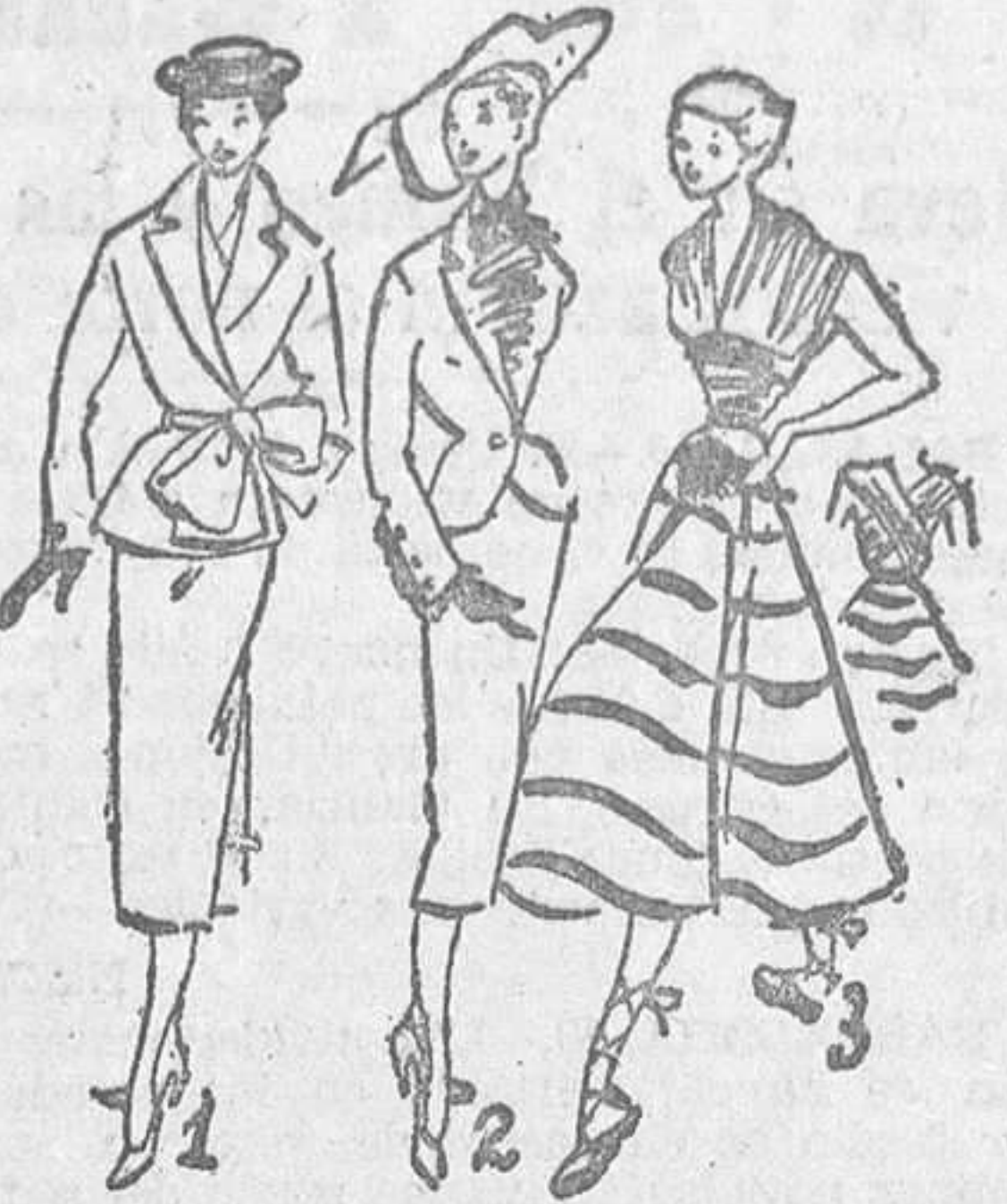
1. Modelo en lanilla roja, con chaleco y gran lazo en piqué blanco.—2. Modelo Sastre negro con chorrera y detalle de mangas en lencería blanca.—3. Modelo Playero. Cuerpo en tricot blanco y falda rayada en rojo, verde y blanco.

Sobriedad, elegancia y buen gusto en la nueva línea de la Moda española