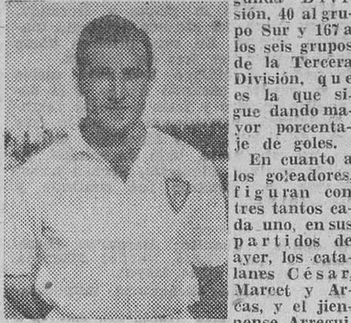
ARREGUI muchos, están Hermida, Almagro, Pepillo y Vila. Los arbitros tuvieron una jornada placida, si exceptuamos al señor Campos Alhóndiga 22 - 1.º o portería.

Y llegamos al capítulo de los expulsados. Únicamente dos merecieron semejante sanción arbitral. Se agredieron mutuamente Bilbao y Robledo, en el partido de Burgos y, naturalmente, fueron expulsados.