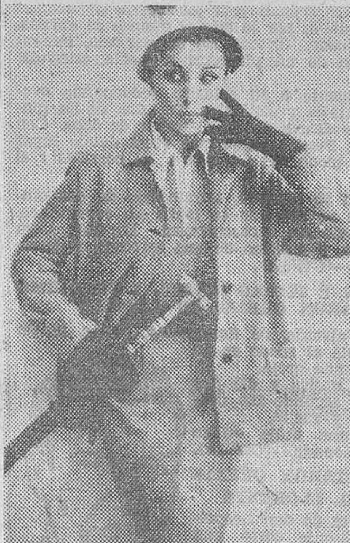
Modelo de vestido y chaquetón del mismo género, último «grito» de la moda londinense.

SON LAVABLES Y CASI IMPOSIBLES DE ROMPER