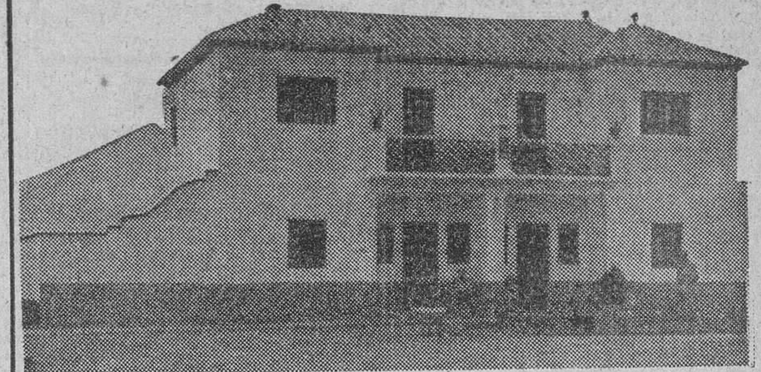
Vista parcial de las viviendas bendecidas y entregadas ayer a beneficiarios de la Policía Armada

EL ALQUILER DE CADA CASA ES DE CIENTO PESETAS MENSUALES