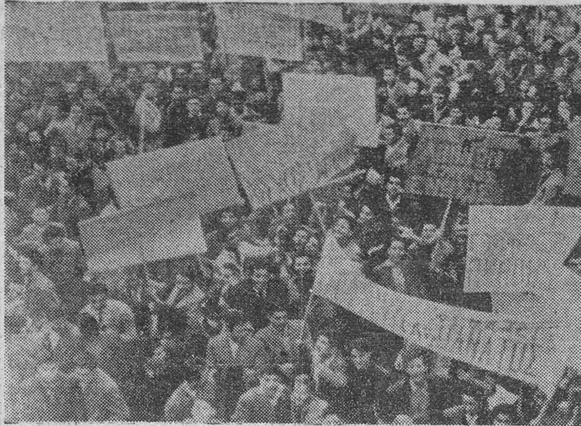
ATENAS.—Estudiantes de la capital llevan grandes carteles pidiendo la isla de Chipre para Grecia, durante la manifestación anti-británica que hubo de ser disuelta por la policía.