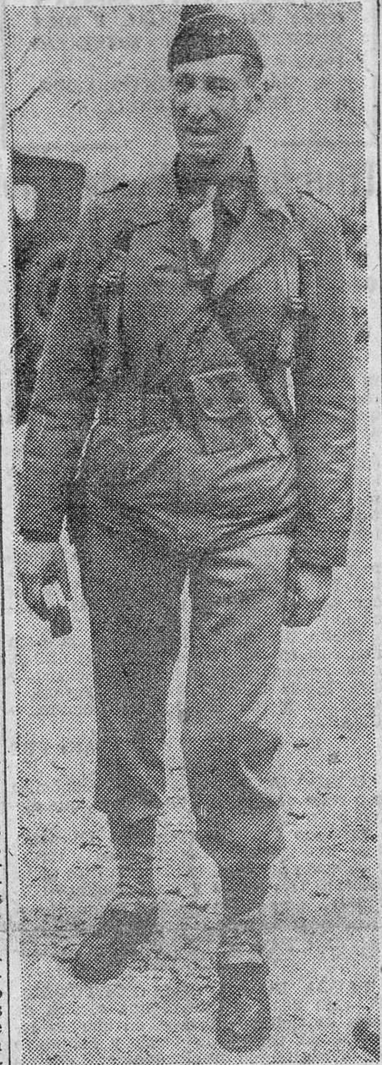
El general Mark Clark, comandante supremo aliado en Extremo Oriente.

SEUL, 26.—Los comunistas han desencadenado nuevos ataques contra las fuerzas nortamericanas y surcoreanas. Bajo lluvia intensa, unos setecientos chinos atacaron las posiciones aliadas al Oeste de Seul, mientras otros tres mil atacaban a las surcoreanas en el extremo occidental de la bolsa del frente central. Los dos ataques fueron rechazados.—(EFE).