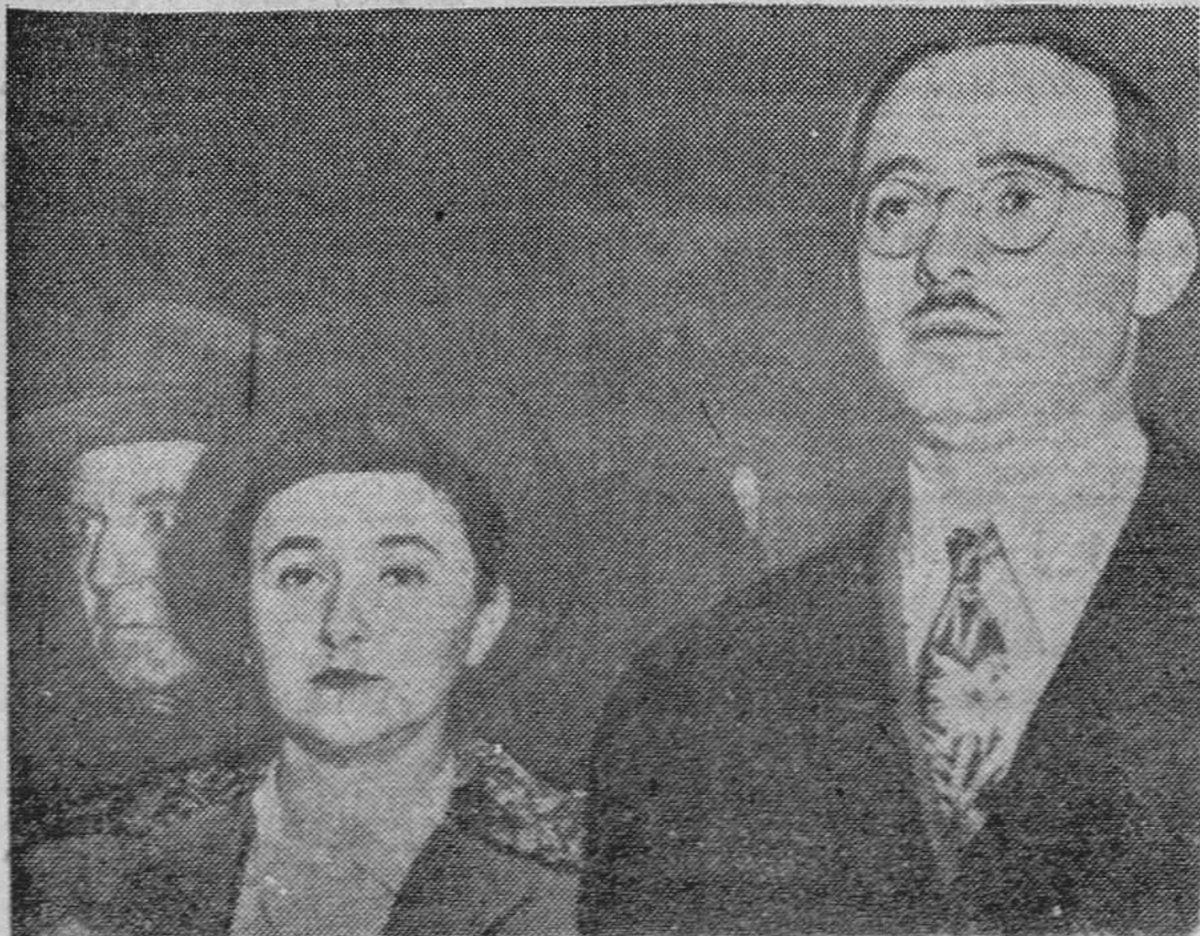
El matrimonio Ethel y Julius Rosenberg, condenados a muerte por espionaje, que serán ejecutados en Sing-Sing si el nuevo presidente, Eisenhower, no concede el indulto.