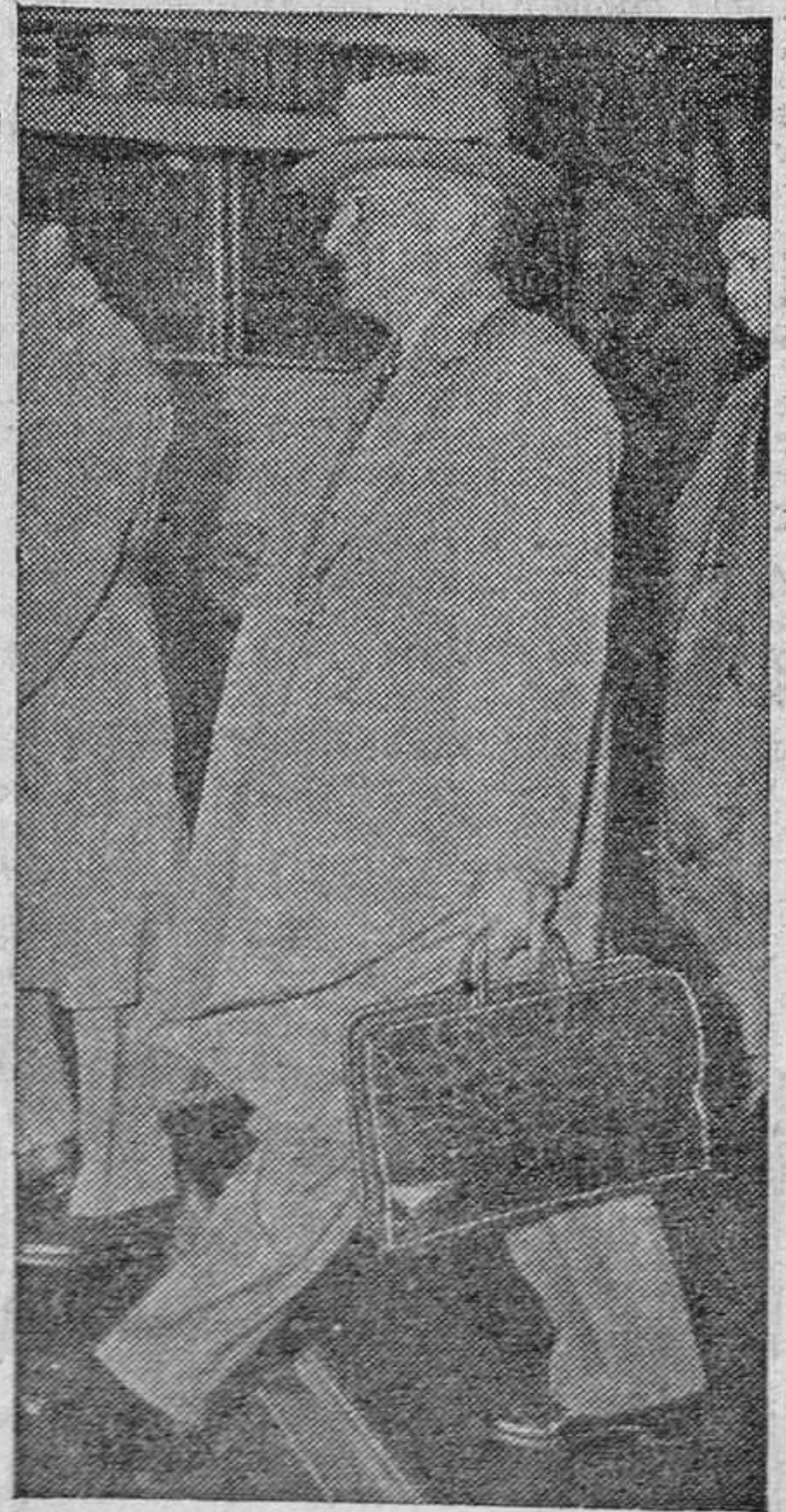
Aquí aparece Mr. Truman. Es una fotografía cogida al azar en el archivo y nada indica ese maletín que porta, como signo de su ya inminente salida de la Casa Blanca, en la que ha permanecido, exactamente, durante siete años y nueve meses. ¡Adiós, Mr. Truman!