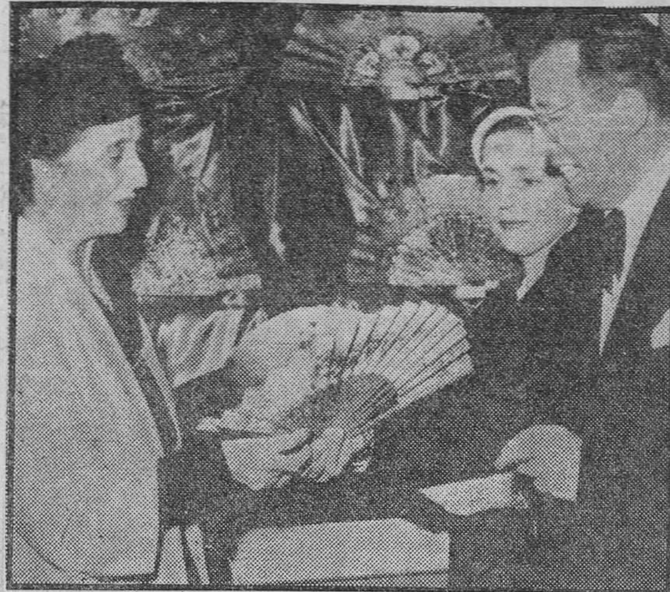
La Exposición del Abanico, organizada en Madrid por la Obra Sindical de Artesanía, fué visitada por la esposa del Caudillo. En nuestra fotografía, doña Carmen Polo de Franco contempla un abanico de los que figuran en el certamen.