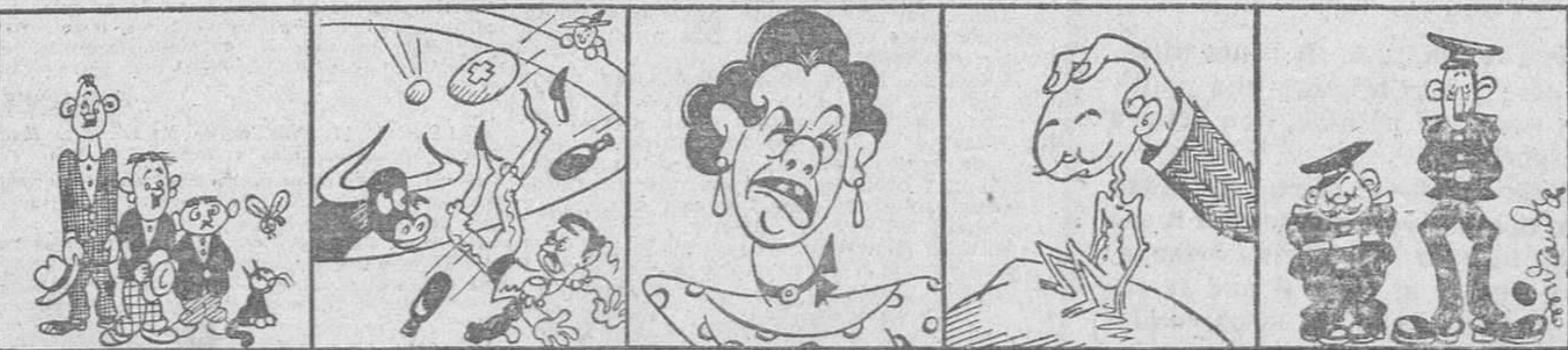
La nutrida comisión,