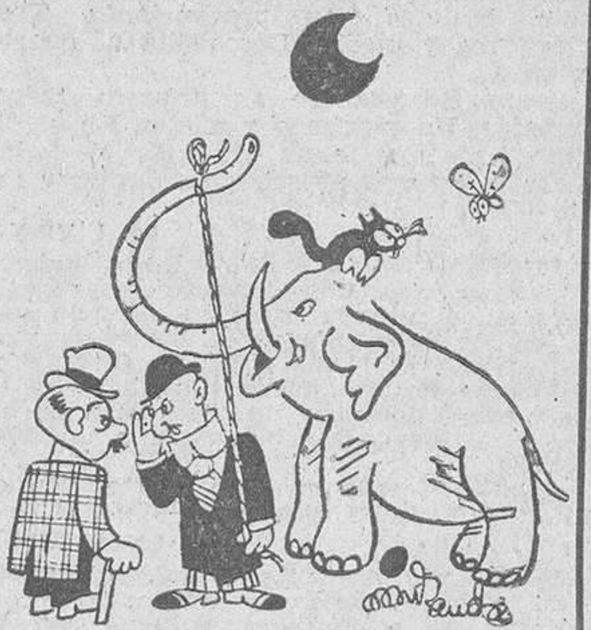
INCORREGIBLES, por Miranda —Ahora estraperlo elefantes...

De los candidatos presentados por el movimiento nacional han sido elegidos 381, o sea, más del 80 por 100.—Efe.