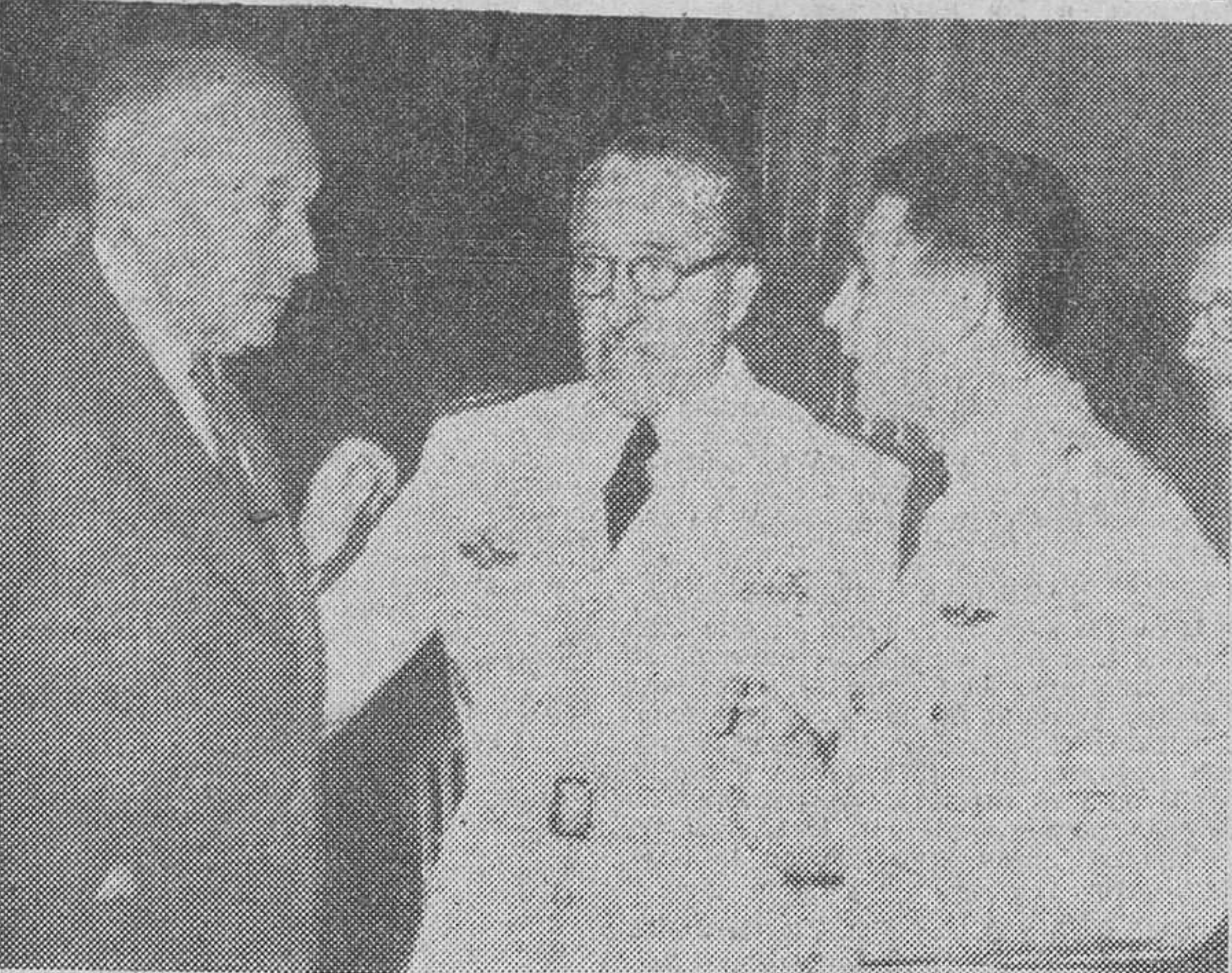
Bajo la presidencia de Mr. Collins, representante del Departamento de Defensa de los Estados Unidos, se ha celebrado la conferencia entre los técnicos norteamericanos y los contratistas españoles, para tratar de las obras en las bases aéreas de Torrejón y Zaragoza. En la foto, Mr. Collins conversa con el delegado del Gobierno español.