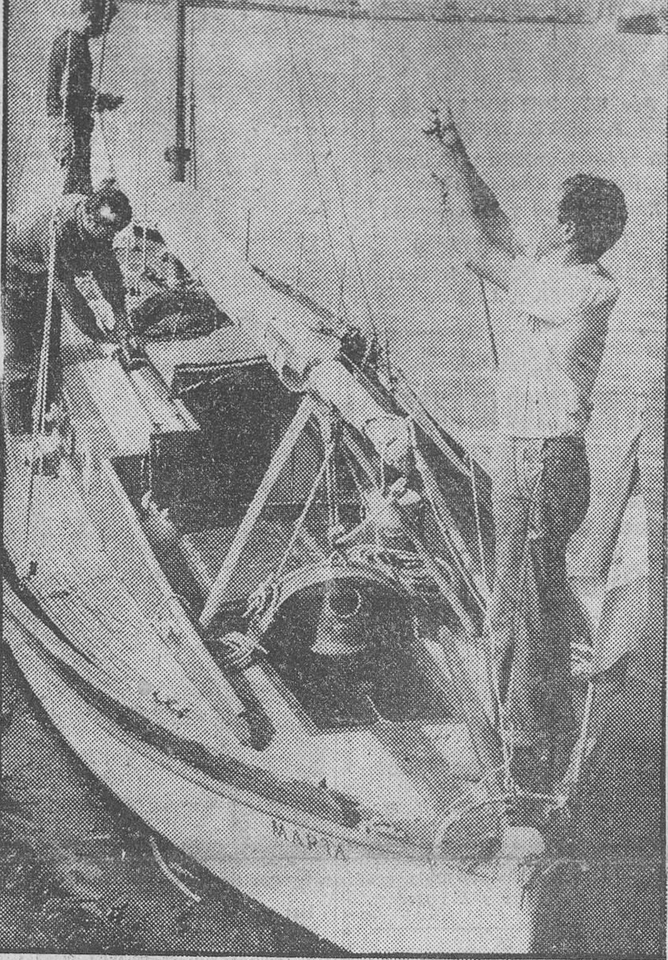
En este barquito, denominado «Marta», tres estudiantes italianos piensan llegar al Brasil. La pequeña embarcación ha sido construida por ellos mismos, en cinco años, en la provincia de Luca, a treinta kilómetros de la costa. Ninguno tiene antecedentes marinos. En la fotografía, los tripulantes se preparan para partir hacia la aventura. ¡Buena viaje!