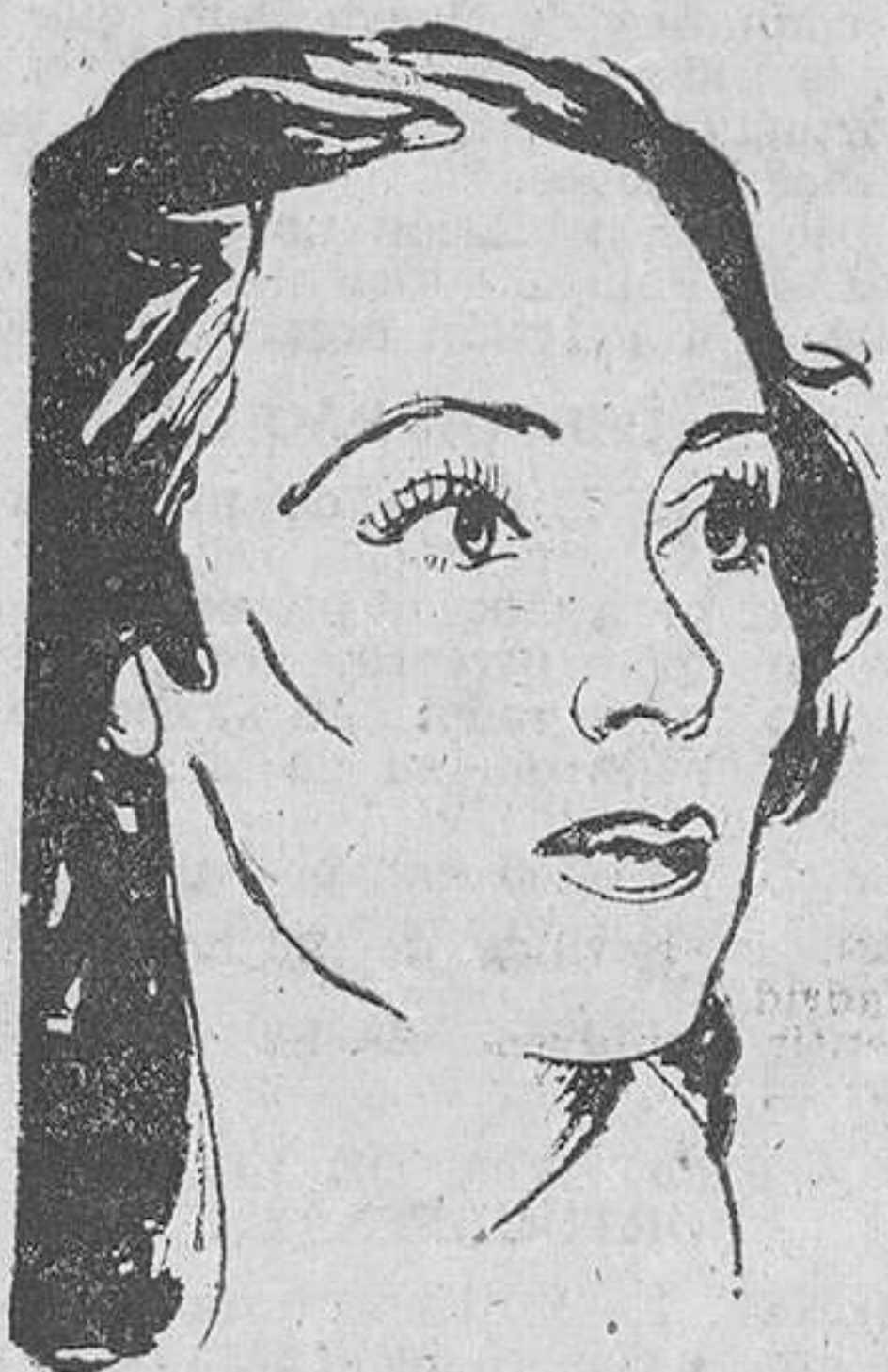
DOLORES DEL RIO

Dolores del Río ha anunciado que tiene el próximo proyecto de ir a Roma para rodar en Italia varias películas.