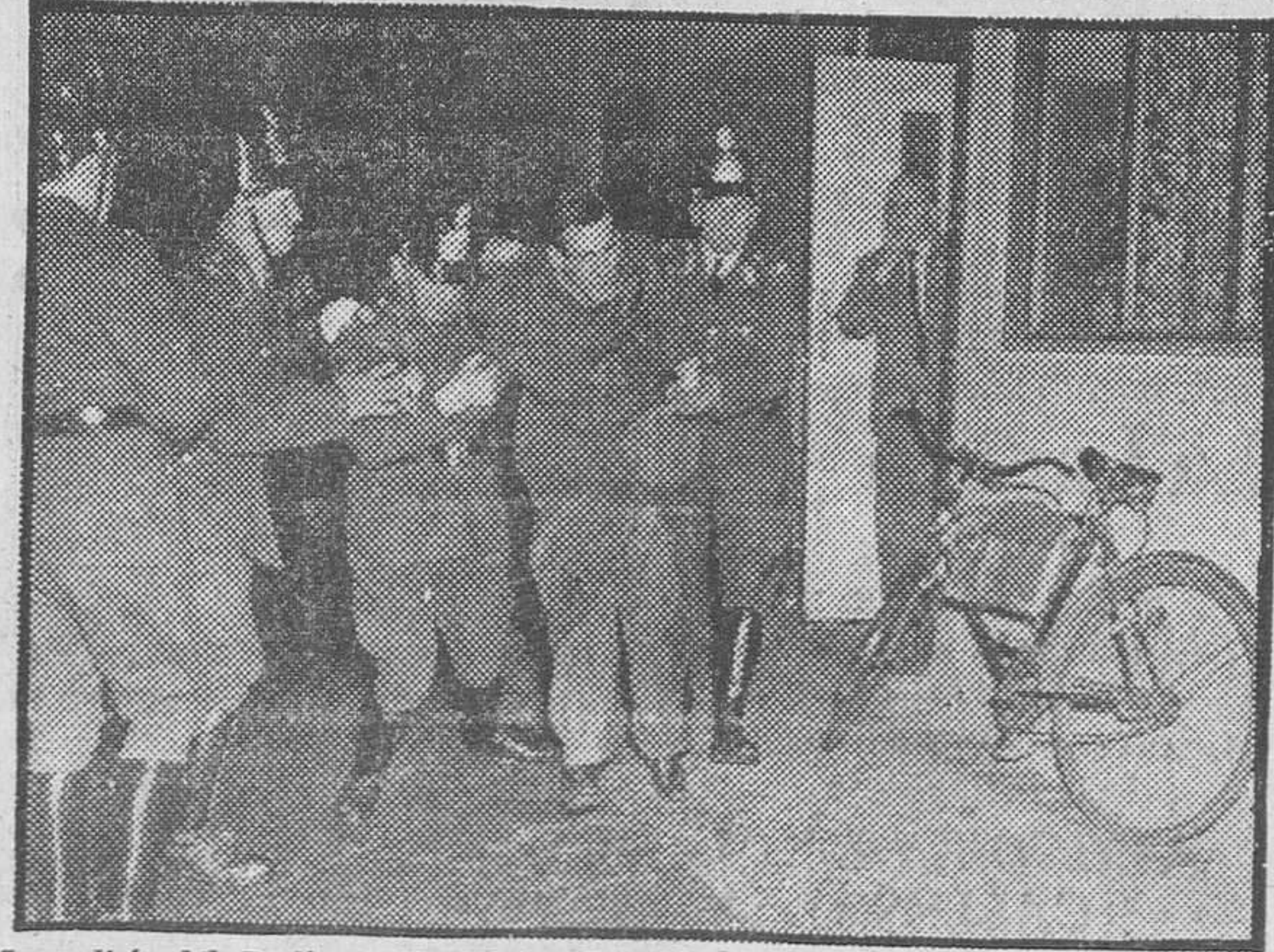
La policía del Berlín occidental ha detenido a varios agitadores comunistas, que intentaban perturbar el orden durante una concentración celebrada para escuchar al general Von Manteuffel. En la fotografía, uno de los agitadores es conducido a viva fuerza por la policía.