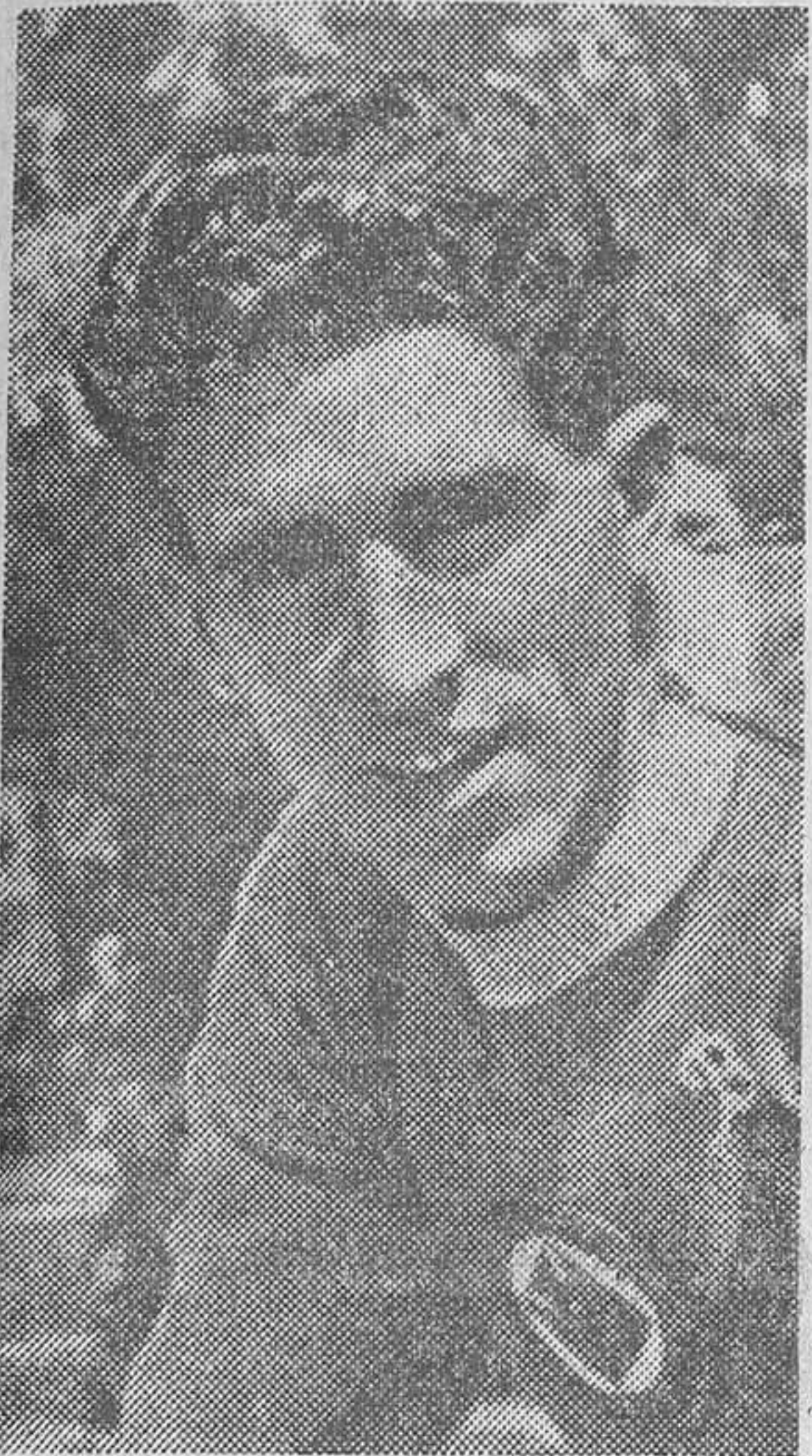
Bahamontes, español, clasificado como rey de la montaña