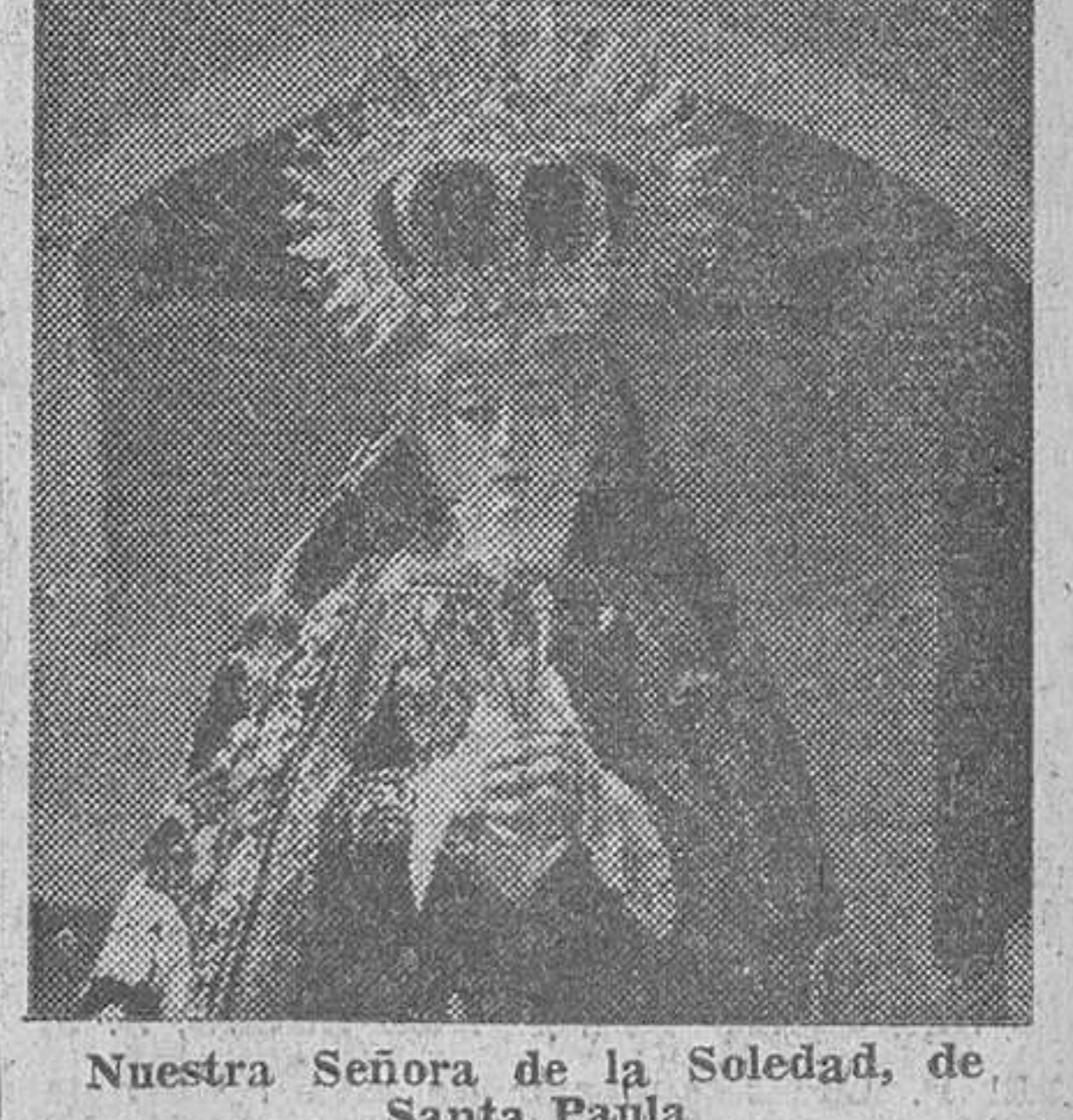
Nuestra Señora de la Soledad, de Santa Paula

La Semana Santa en Granada ha cambiado radicalmente de pocos años a esta parte. Estas solemnidades, en nuestra infancia, tenían aire más devoto y recogido que lo tienen ahora. Los oficios, la visita a los Sagrarios, el Santo Entierro, los sermones de Siete Palabras y de Soledad, y en los espacios libres, el Via Crucis o la Corona Dolorosa rezados en el hogar, o las largas lecturas del libro de la Oración y Meditación del incomparable P. Granada para la rumia piadosa de la Pasión del Dios-Hombre o de los Dolores de su Madre. Y, todo así, hasta que el velo del monumento se rasgaba en la jubilosa mañana del Sábado de Gloria y las alborozadas campanas hendían el aire de tristeza pasada y como a su señal respondían los chicos con alegres exclamaciones y con el repique-teo de sus campanillitas de barro. Aunque el espíritu de la Semana Santa ha variado mucho entre nosotros, no es fácil cambiar en absoluto el carácter de un pueblo. En el recogimiento de antaño había mucho de la condición granadina, como en medio de las exterioridades de ahora conservamos algo de la pasada devoción oculta. Esa continuidad en lo que tan diverso por fuera aparece, lo recoge, espejo fidelísimo, el arte. En nuestra actual Semana Santa, plena de procesiones fastuosas algo prosigue y revive las venerables y devotísimas meditaciones del Padre Granada, y ese algo, que es el callado dolor, el hondo sentimiento, la oculta congoja ante el drama de