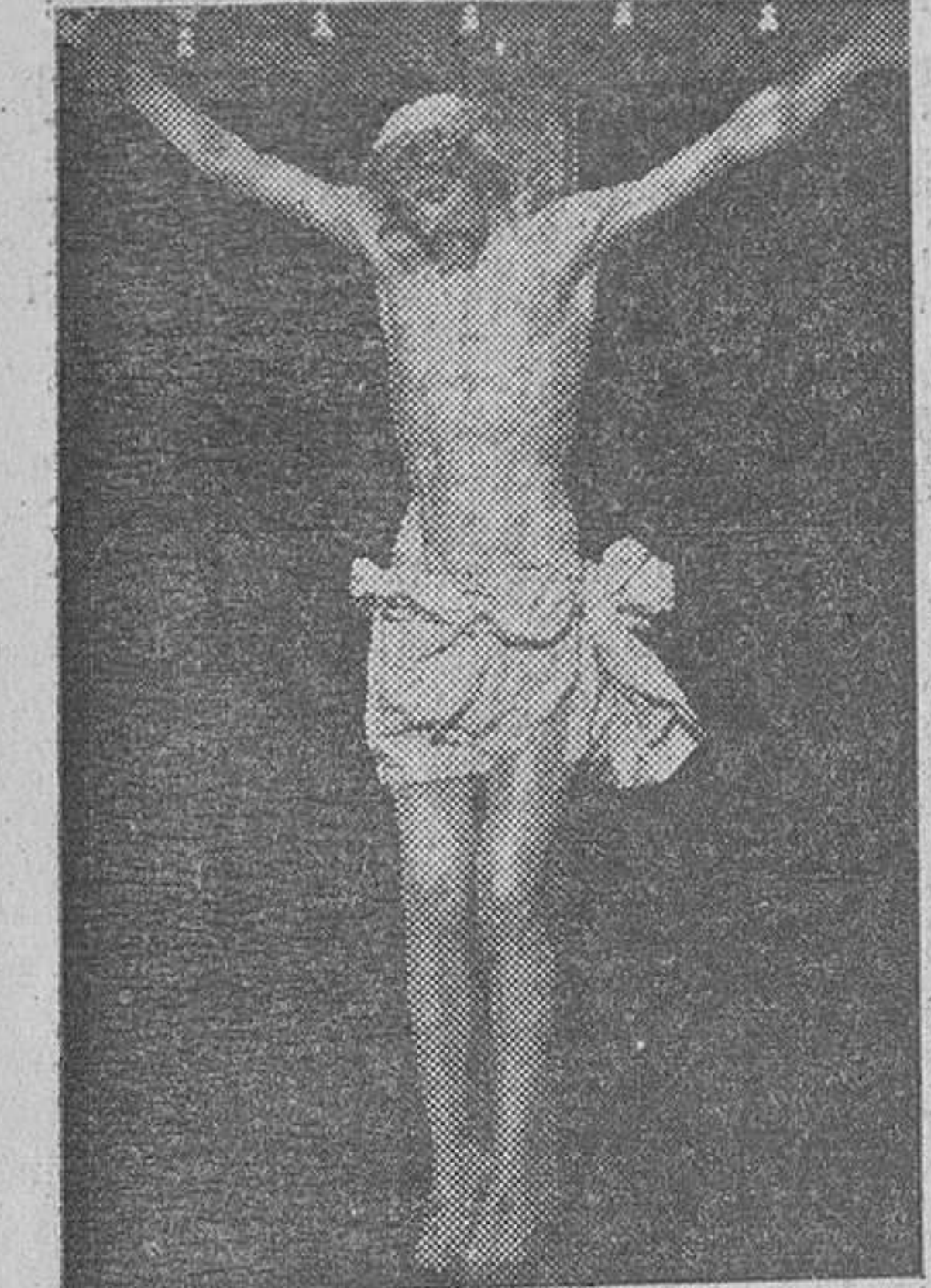
Santísimo Cristo del Consuelo