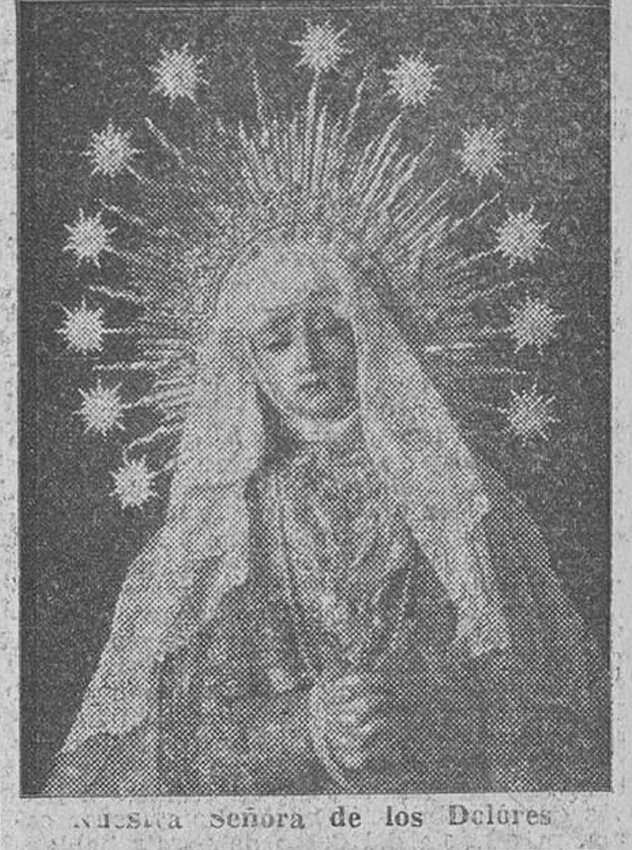
Nuestra Señora de los Dolores