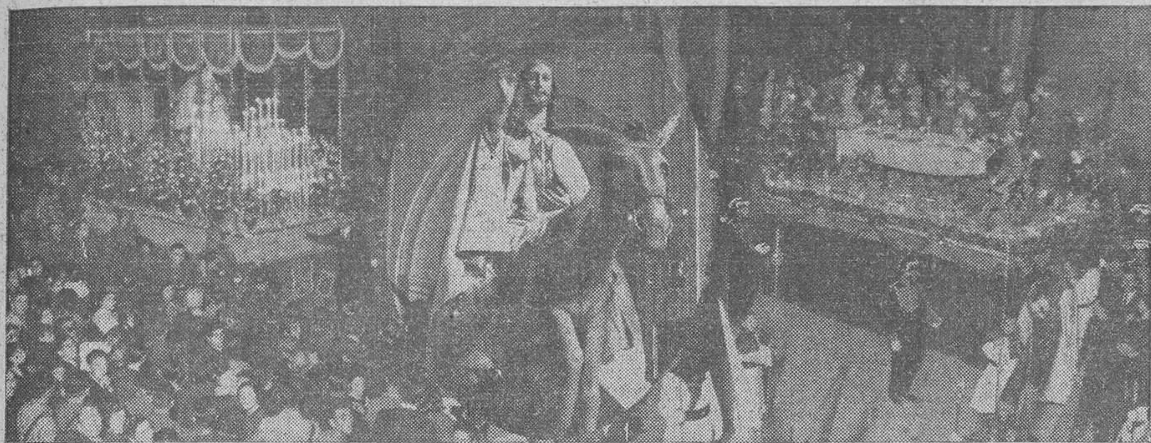
Ayer comenzó, con gran brillantez y solemnidad, la Semana Santa granadina: A la derecha, la imagen de Nuestra Señora de la Victoria, a la salida del templo de Santo Domingo. A la izquierda, el paso de la Santa Cena Sacramental, en su recorrido por nuestras calles. En óvalo, la imagen que representa la entrada de Jesús en Jerusalén, cuya procesión vuelve a figurar en nuestros desfiles de la Semana Mayor, organizada este año por la Federación de Cofradías