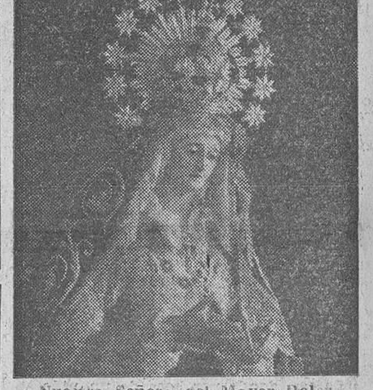
Nuestra Señora del Mayor Dolor