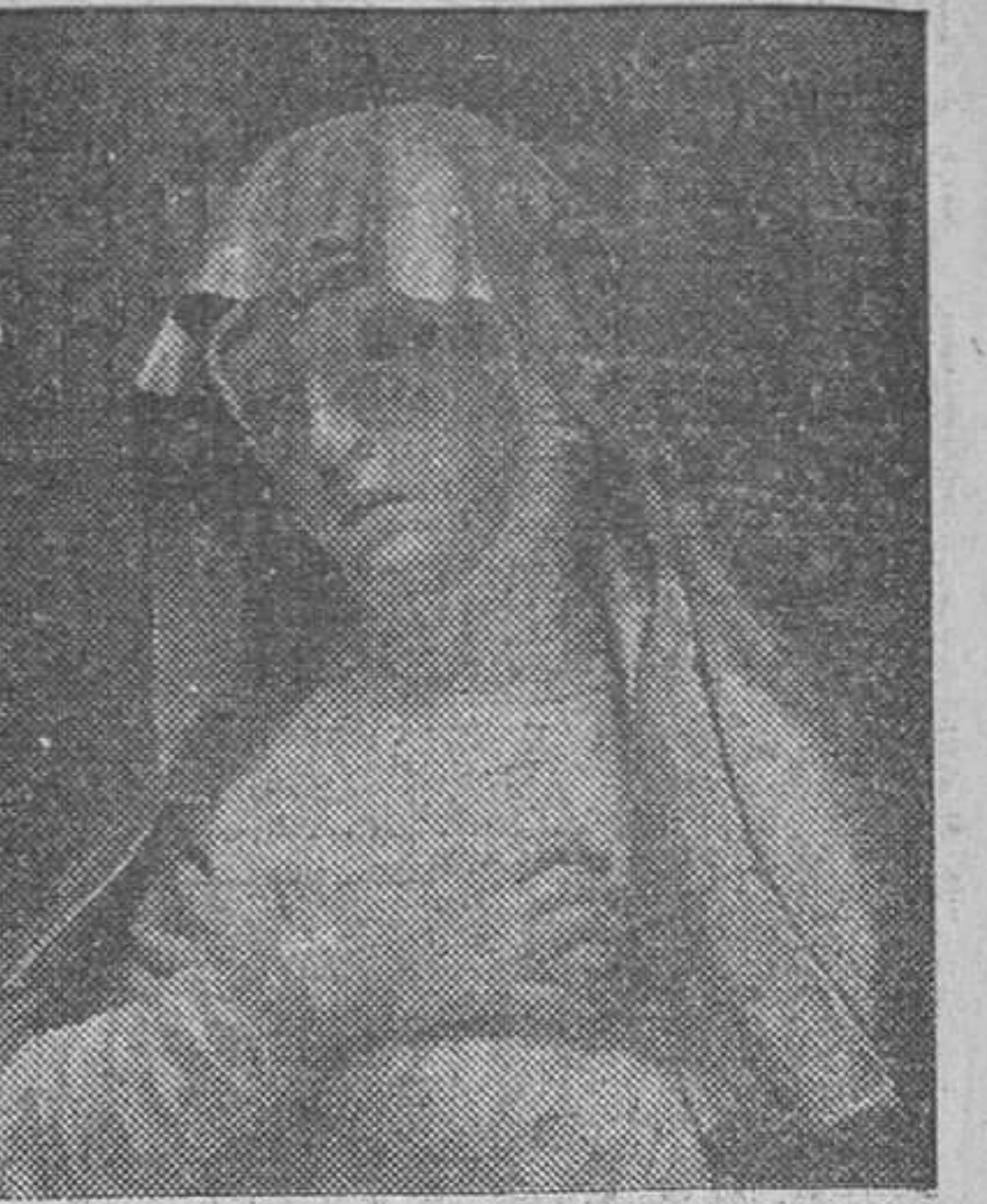
Nuestra Señora de los Dolores