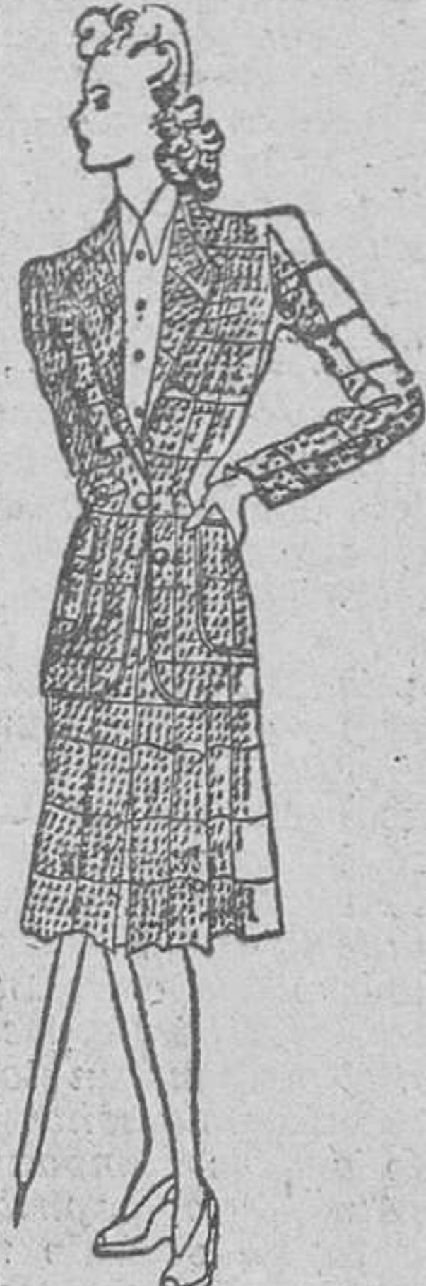
Traje sastre clásico, de cuadritos blancos y negros. Blusa camisera roja.

Con poco gasto, ciertamente, cabe proporcionarse un cierto número de "foaletas" distintas, aprovechando retales de batista o lienzo fino, incluso combinando uno de rayas, por ejemplo, con otro de un solo tono.