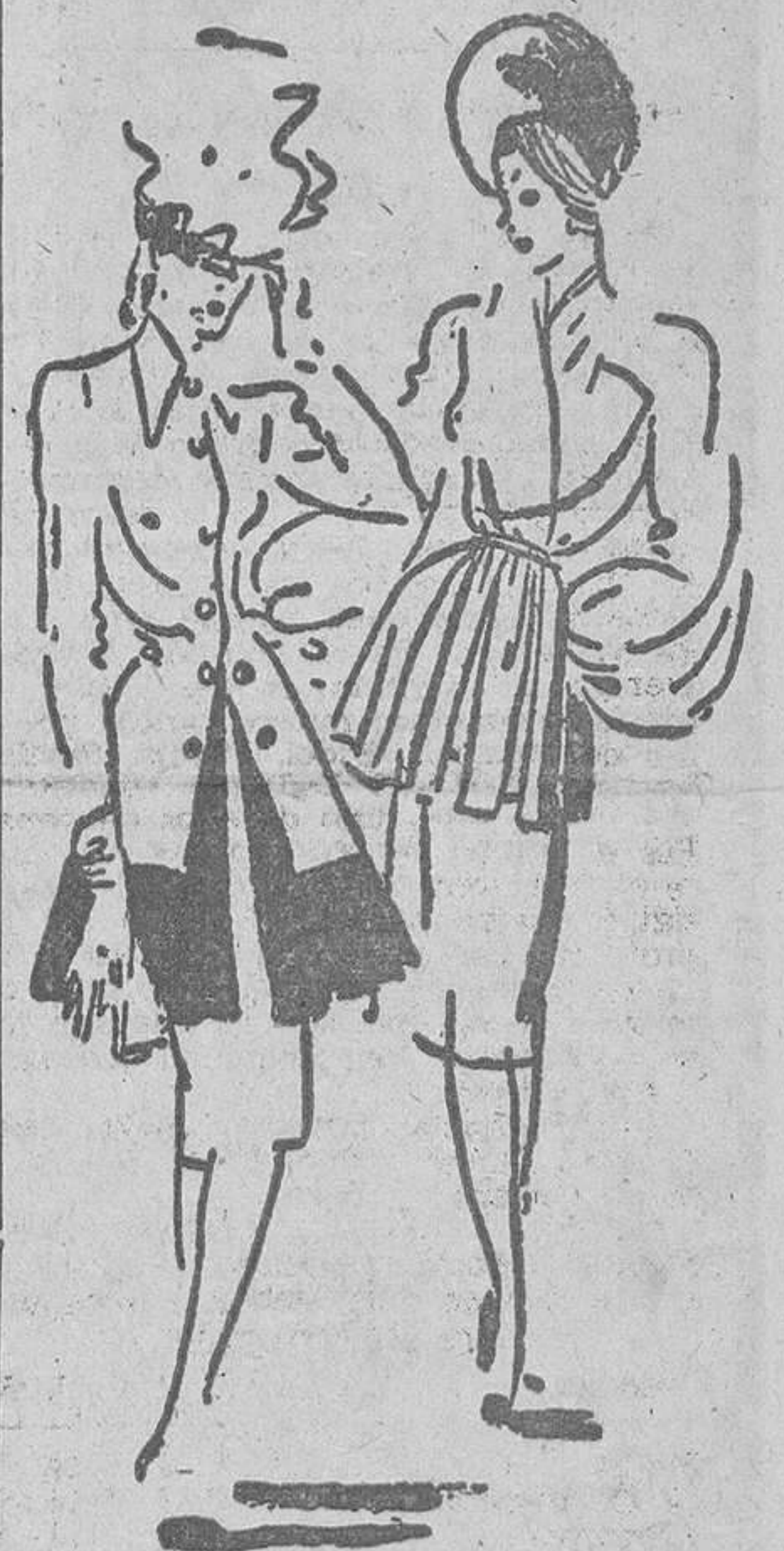
Dos distintos modelos de chaquetas, que pueden llevarse sobre un traje de mucho vestir.

La mujer de negocios: Una perspectiva prometedora. Puede hablar con su marido de asuntos y cotizaciones en Bolsa y en último caso sabría ganarse la vida. Pe-