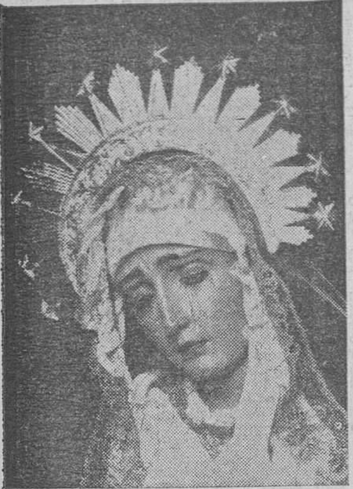
Virgen de la Esperanza

Callado dolor, hondo sentimiento, oculta congoja ante el drama de la Pasión. Todo ello lo plasman y concretan las viejas imágenes que por nuestras calles desfilan