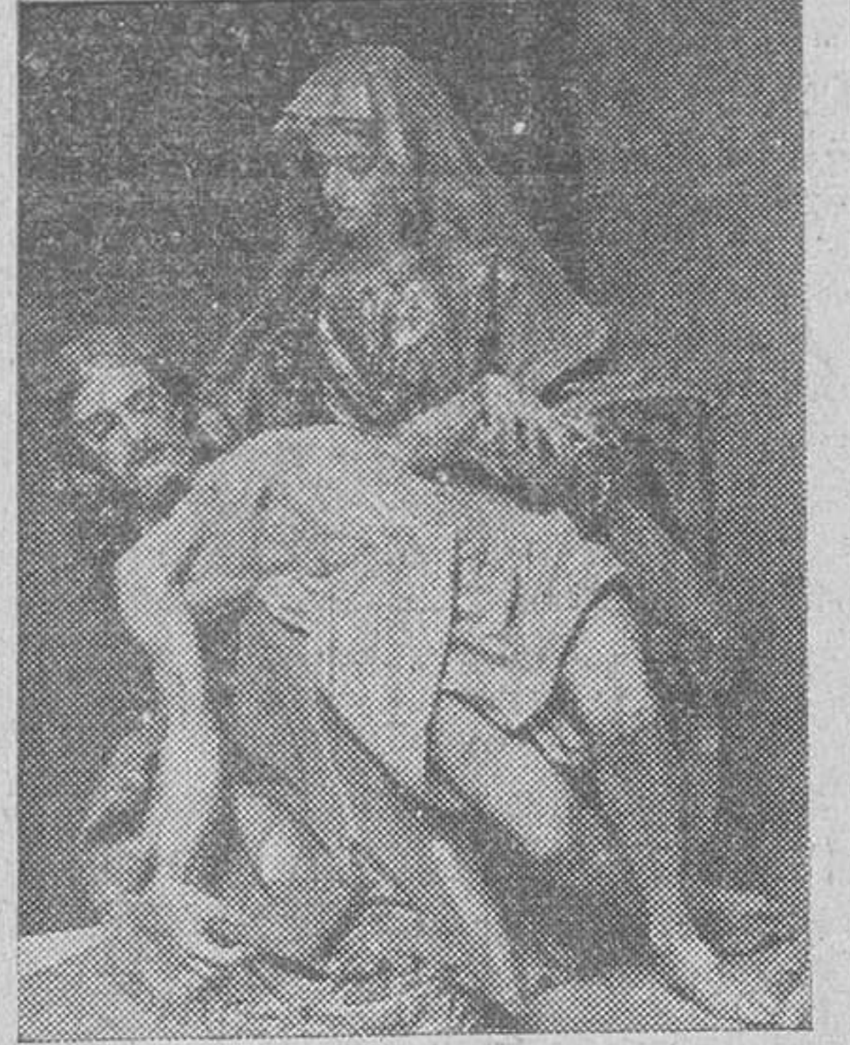
Santa María de la Alhambra

la Pasión, lo plasman y concretan las viejas imágenes que por nuestras calles desfilan. ¿No recordáis aquella sublime "Meditación del desconsuelo de Nuestra Señora en la Soledad", de