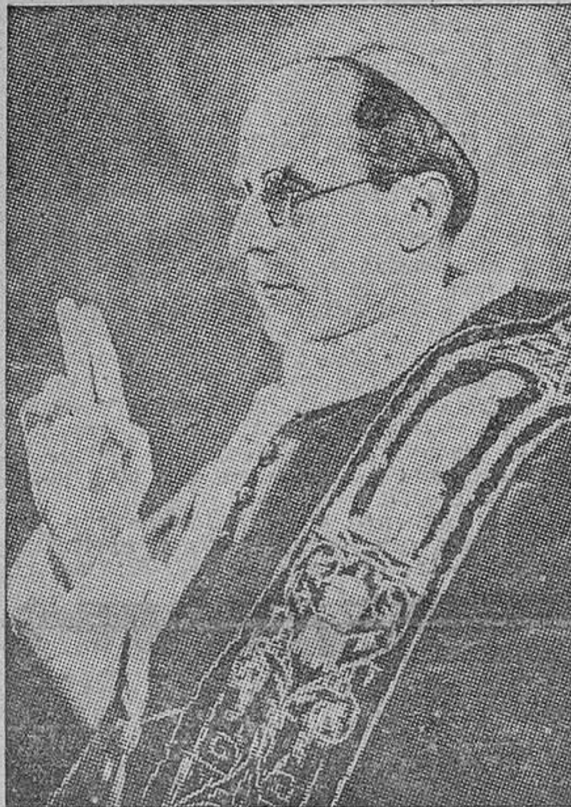
SU SANTIDAD PIO XII

pletamente la inmensa Plaza de San Pedro. Para facilitar la audición, fueron colocados en diversos lugares de la Plaza potentes altavoces.