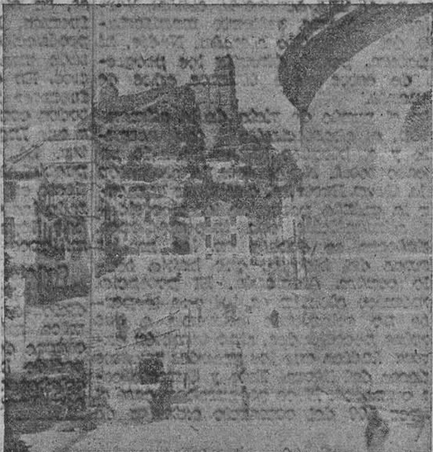
Una vista de Montefrío

DÍA 17. —A las diecisiete, gran carrera ciclista organizada por las Agrupaciones Juveniles de Falange, con un magnífico premio para el vencedor.