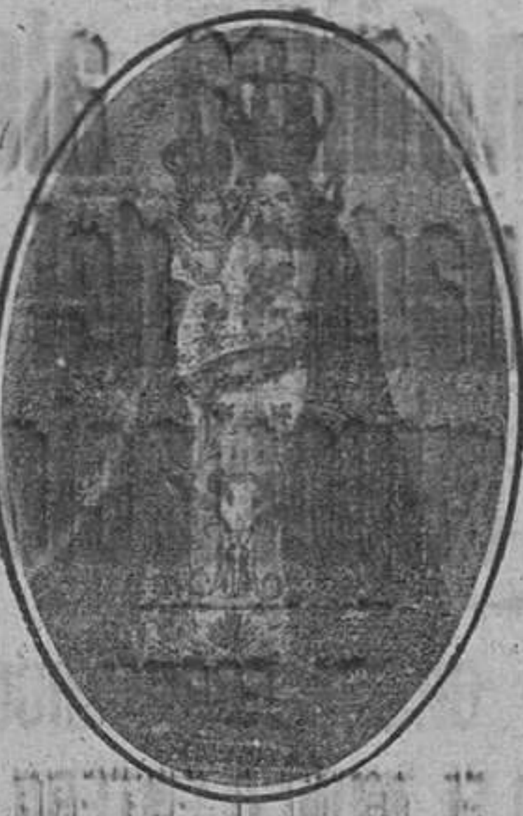
La venerada imagen de Ntra. Sra. de los Remedios, Patrona de Montefrío

Montefrío, el pueblo alegre y la boñosa, que escribió una página gloriosa en nuestra pasada Cruzada, se prepara este año para celebrar con el máximo esplendor sus fiestas en honor de su Patrona la Santísima Virgen de los Remedios, bajo cuya advocación ha vivido siempre con fervido entusiasmo.