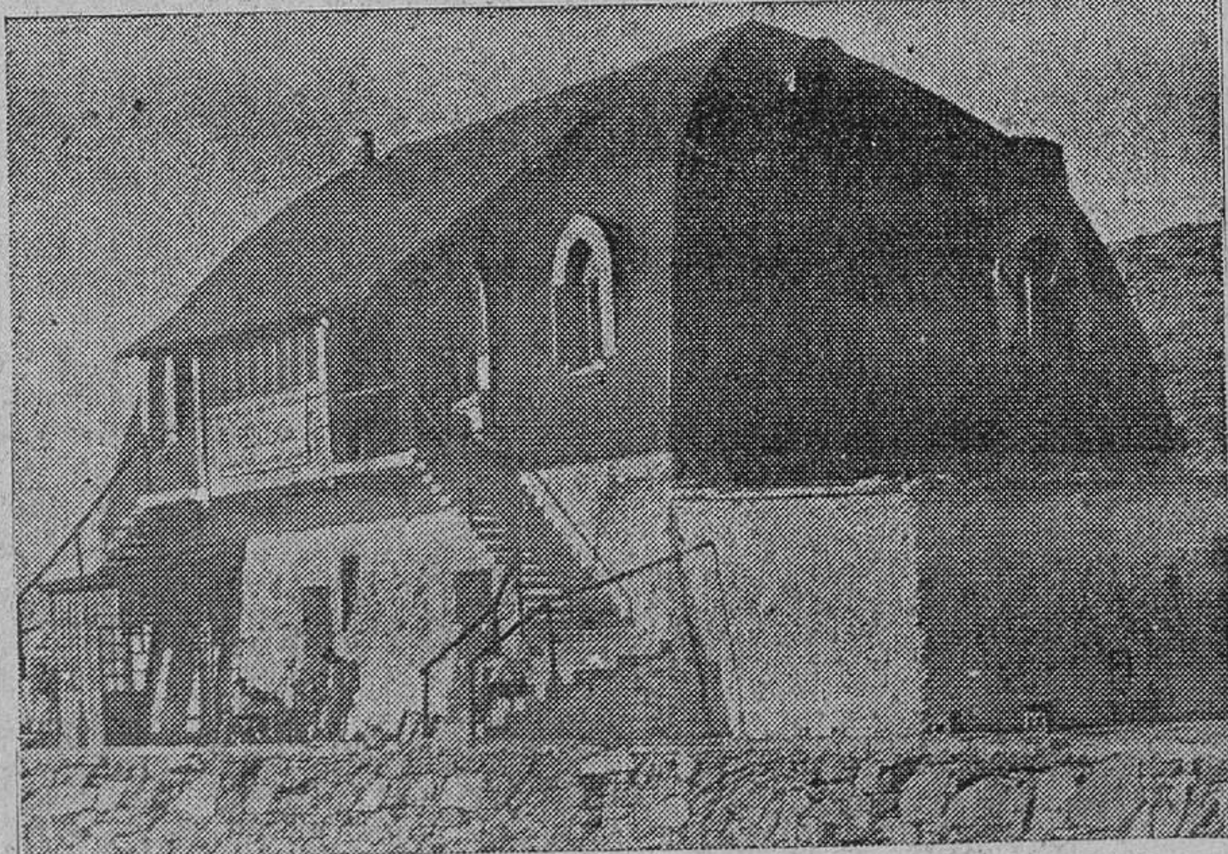
Albergue José María Collantes, en Sierra Nevada.

de ninguna clase y en un medio hostil, ha sabido salir de todas las dificultades con un camino recto y digno, que ya reconocen una gran parte de los pueblos del mundo, aunque los sectarismos de partidos y los compromisos de oscuras componendas políticas, pretenden retardar el triunfo de la verdad española.