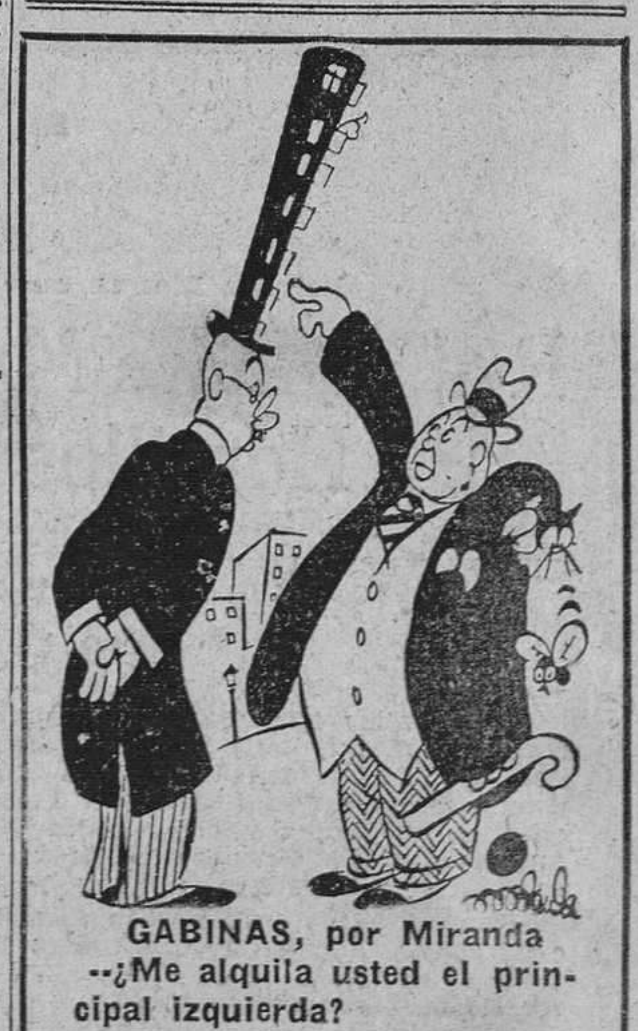
GABINAS, por Miranda —¿Me alquila usted el principal izquierda?

En suma, se ha llevado Granada en este sorteo la bonita suma de doscientas mil pesetas.