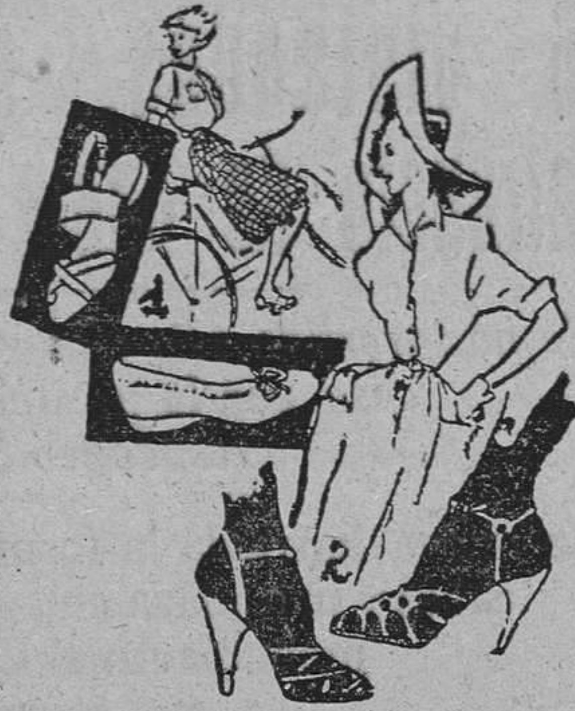
1.—Zapatos en piel de color vivo. (Litty) o «dorero» en color. 2.—Zapatos estilo italiano en blanco

Muchos de los destinados para noche llevan tirillas doradas o plateadas, tan ligeras, que los pies de las mujeres que los lucen parecen los de aquella Cenicienta, protagonista del delicioso cuento de Perrault. Como calzado cómodo, para las mañanas en la ciudad y las diversas manifestaciones del verano: campo y playa, están en gran boga las sandalias de tela en colores, cerradas a un lado por una hebilla. Y, sobre todo, los zapatos que en Norteamérica denominan «digty» y aquí en España, «dorero». Bajos, forma zapatilla, con o sin lazo encima y en colores vivos que armonizan perfectamente con las ropas blancas o multicolores de verano. En resumen: Tacones finos, frágiles, con suela también delgada, o los opuestos: bajos, cómodos, casi casi zapatillas como de andar por casa.—C.