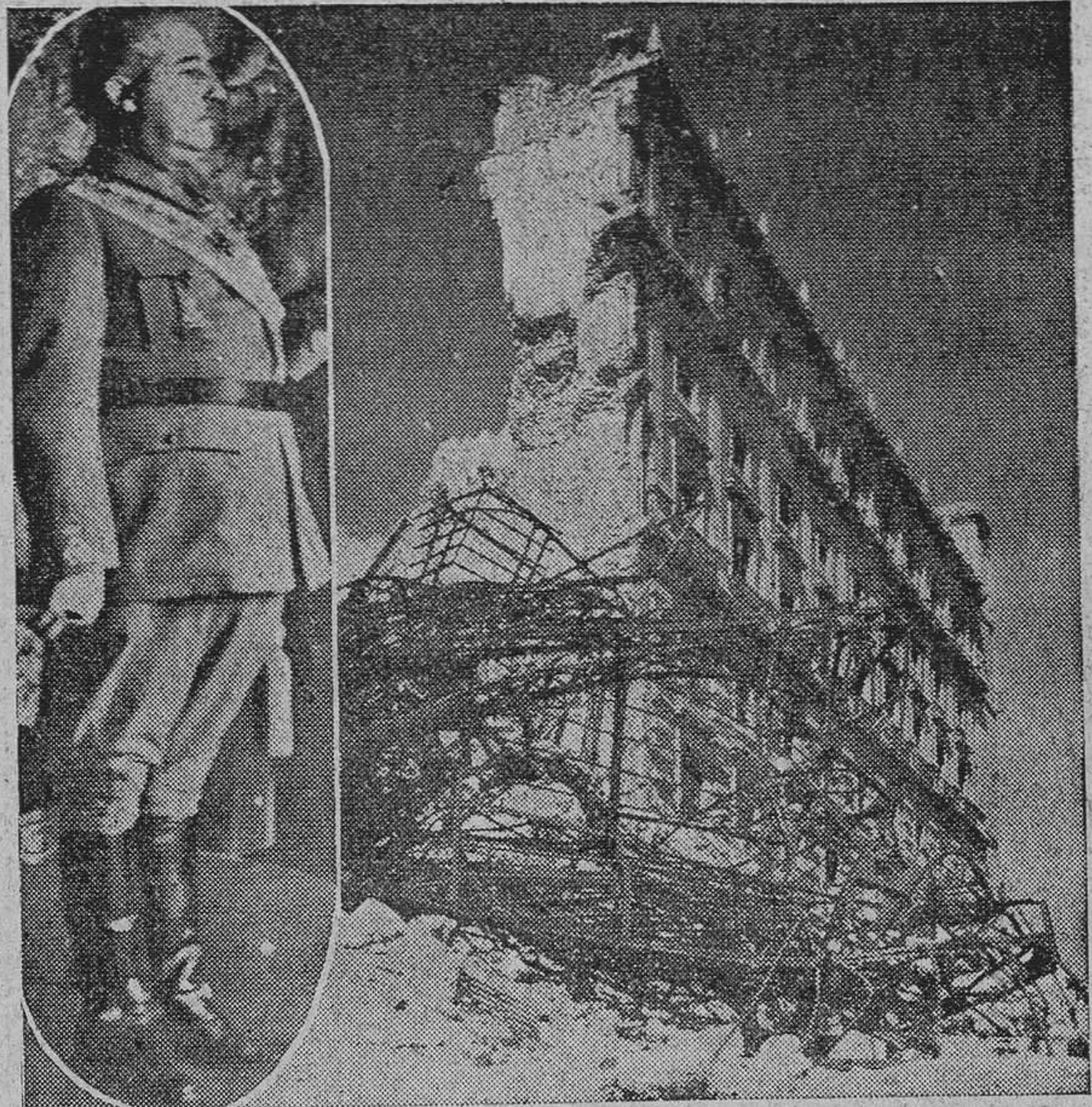
La figura del Jefe del Estado, Generalísimo Franco, héroe de la guerra española contra el comunismo y forjador del resurgimiento en la paz, es para los españoles garantía de una Patria libre y de grandes destinos. Junto al Caudillo, el haz apretado de los verdaderos españoles que supieron hacer todos los sacrificios por Dios y por España. Palpitante ejemplo son los héroes del Alcázar toledano, cuyas ruinas gloriosas serán testigo perpetuo de la gran gesta nacional.

Y para remachar este triunfo político, el aumento de naciones que envían jefes de Misión a España, el adoptar como idioma de trabajo en la O.N.U. la lengua castellana y los acuerdos comerciales que cada día se amplían. Estos triunfos en el exterior, han sido conseguidos sin ningún género de capitulación ni componenda por parte de España, que no ha hecho ninguna concesión y que conserva su absoluta independencia de acción. España, sin Plan Marshall, sin ayuda