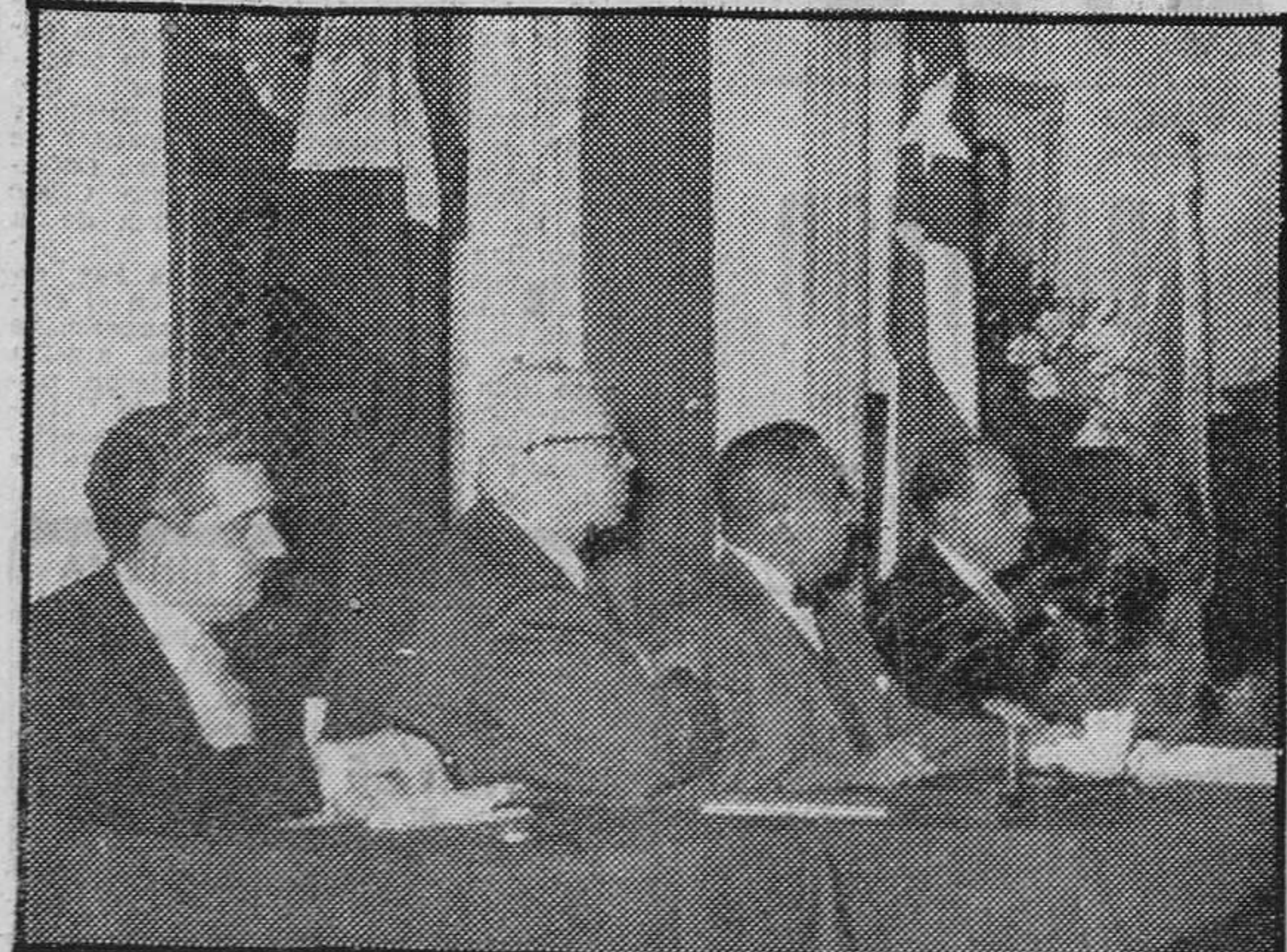
El embajador de la República de Filipinas en Madrid ha impuesto la Encomienda de la Orden de Caballero de Rizal al embajador de Cuba en España, señor Irazoz; al director general de Archivos y Bibliotecas, señor Sintés Obrador; y al catedrático y escritor señor Giménez Caballero. El acto se celebró en el Círculo Filipino de la capital de España y asistieron los embajadores y ministros de las Repúblicas hispanoamericanas y distinguidas personalidades españolas.