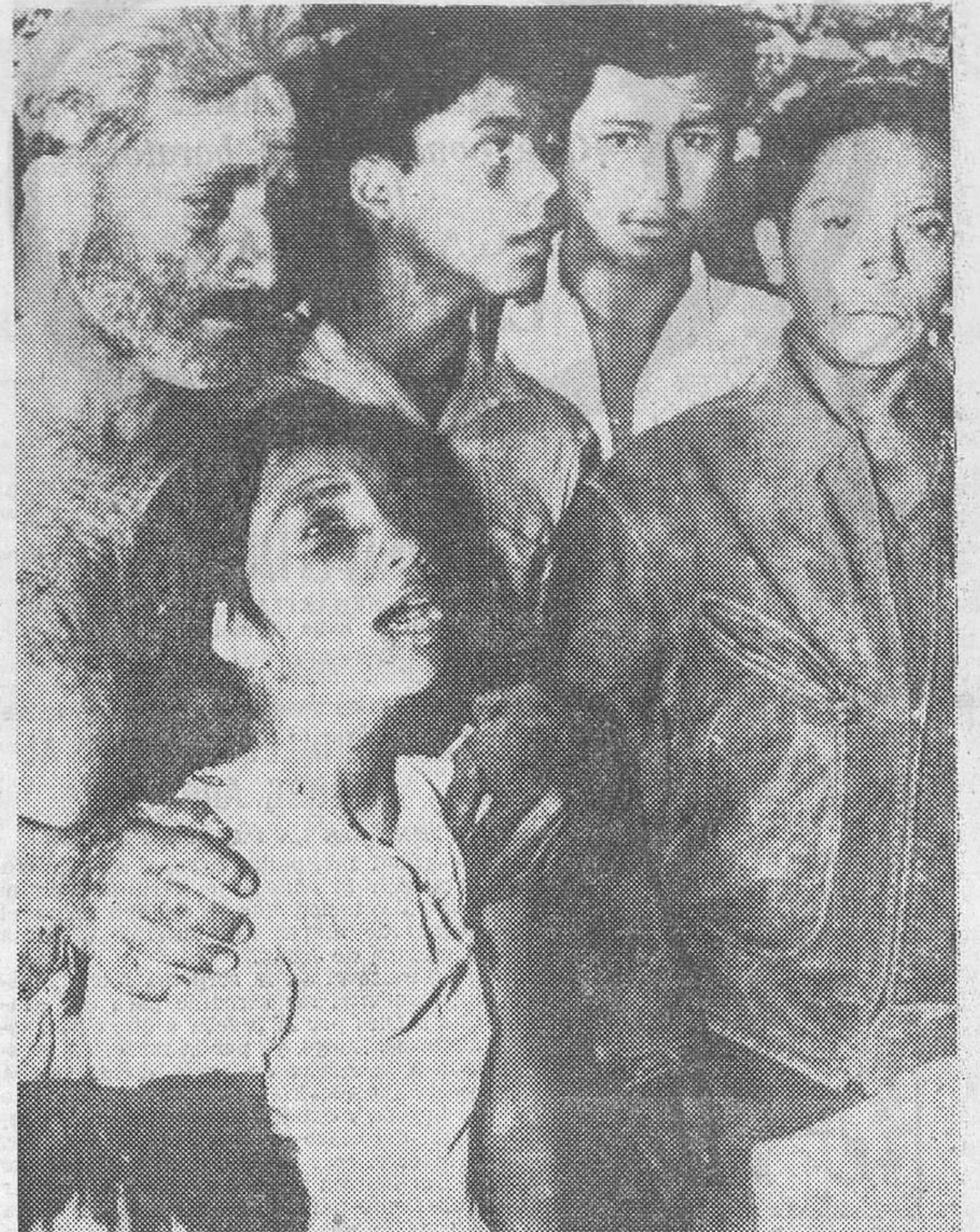
Varios afectados por el terremoto de San Salvador observan las ruinas de sus casas, donde murieron dos niños de cinco y ocho años, al producirse el derrumbamiento del edificio, como consecuencia del terremoto que azotó a San Salvador