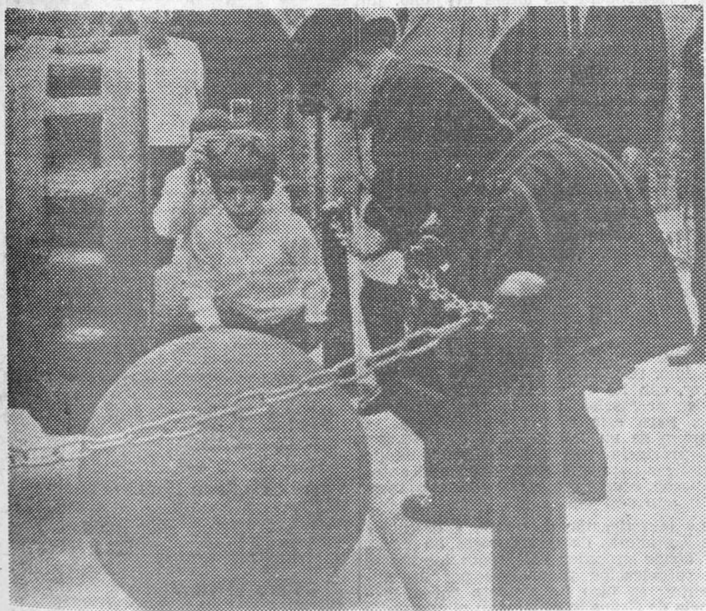
El pequeño John Kennedy, hijo del que fue presidente de los Estados Unidos, John F. Kennedy, ha visitado, durante su estancia en Londres, la Torre de Londres. En la foto, el pequeño Kennedy admira la munición de un antiguo cañón turco