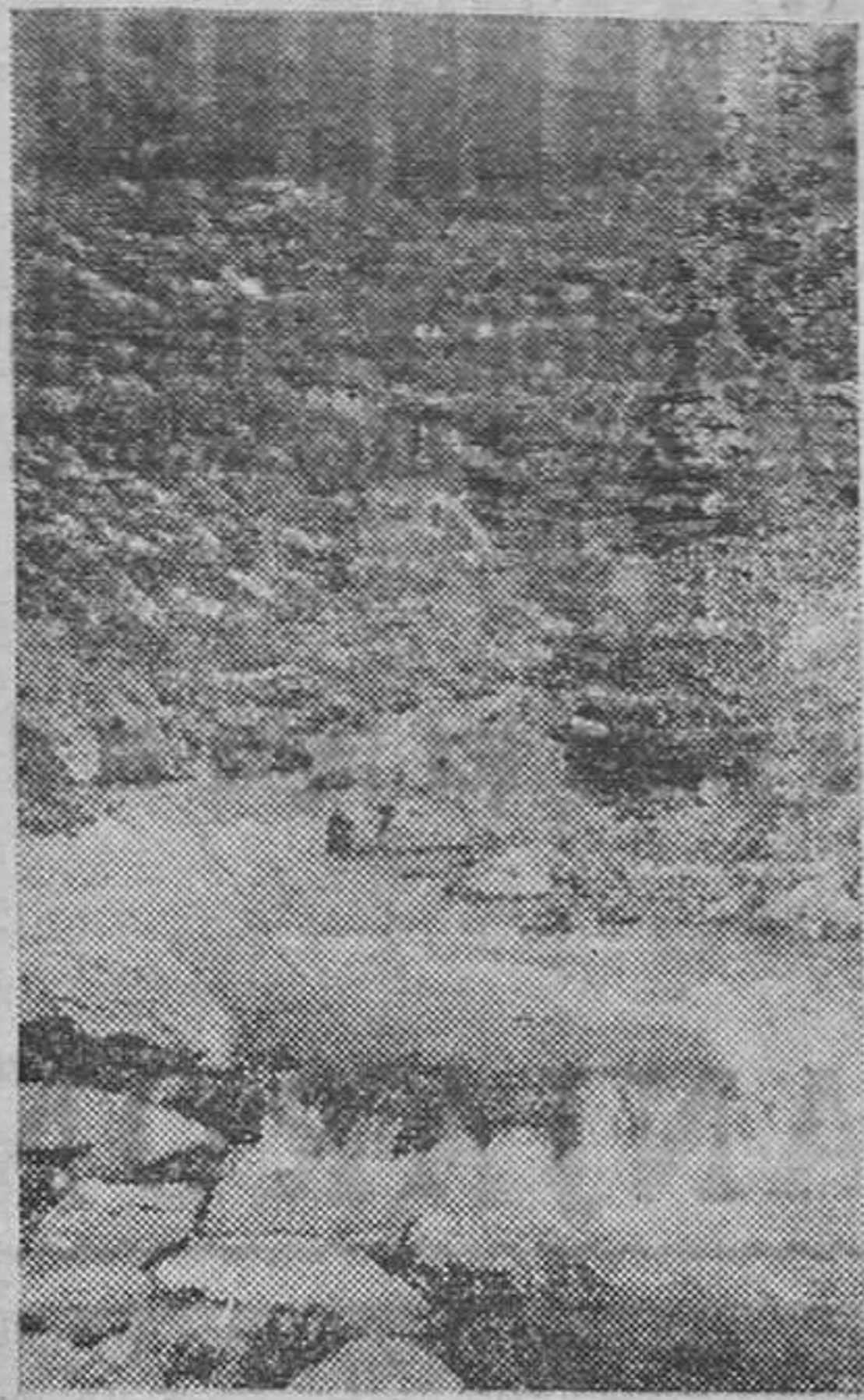
Una de las más bellas vistas que se descubren desde Lanjarón, cuyo término municipal nace a doscientos metros sobre el nivel del mar para elevarse hasta los 3.400

Continuamos nuestro plan de divulgación de la vida económico administrativa y social de los pueblos de nuestra provincia, dedicamos hoy varias columnas de este periódico a Lanjarón.